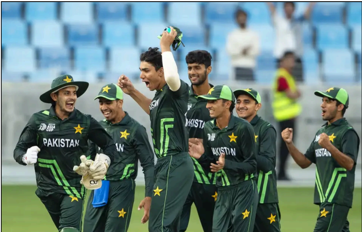
ডুবাইত চলি থকা অনূৰ্থ ১৯ এছিয়া কাপত ভাৰতৰ বিৰুদ্ধে জয়ৰ পিছত পাক দলটো, শনিবাৰে