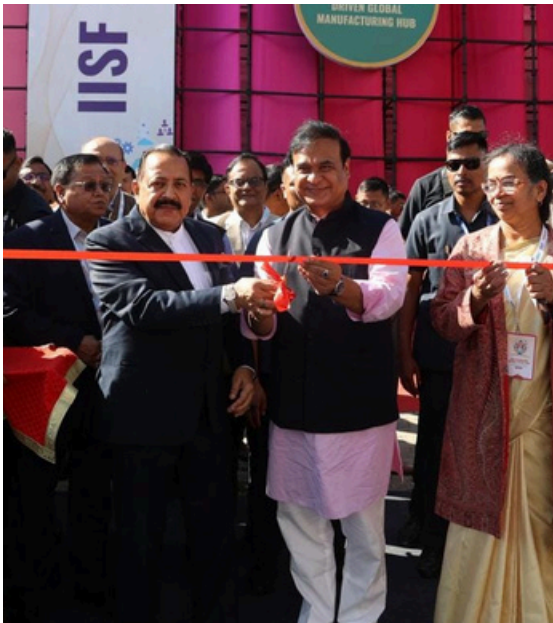
ভাৰত আন্তঃৰাষ্ট্ৰীয় বিজ্ঞান মহোৎসৱৰ শুভাৰম্ভণী অনুষ্ঠানত মুখ্যমন্ত্রী ড॰ হিমন্ত বিশ্ব শৰ্মা