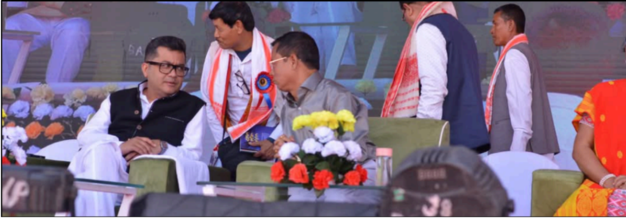
মাজুলীত জননেতা ভীমবৰ দেউৰী দিবস অনুষ্ঠানৰ এটি মুহূর্ত

কংগ্ৰেছ নেতা গৌৰৱ গগৈক কটাক্ষ কেন্দ্ৰীয় মন্ত্ৰী পৱিত্ৰ মাৰ্ঘেৰিটাৰ