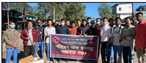
ছেখোৱাত আছৰ সজাগত সপ্তাহ পালন