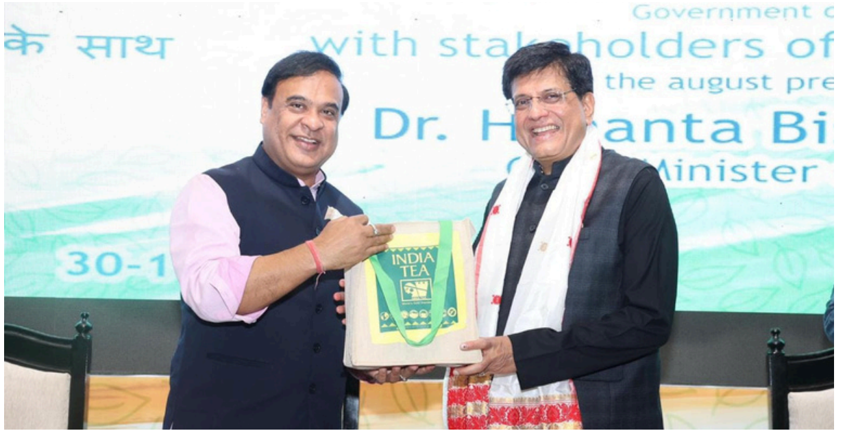
অসমৰ চাহ উদ্যোগৰ সম্ভাৱনা আৰু সংকটক লৈ কেন্দ্ৰীয় মন্ত্রী পীয়ুষ গাৱেলৰ সৈতে আলোচনা মুখ্যমন্ত্রীৰ