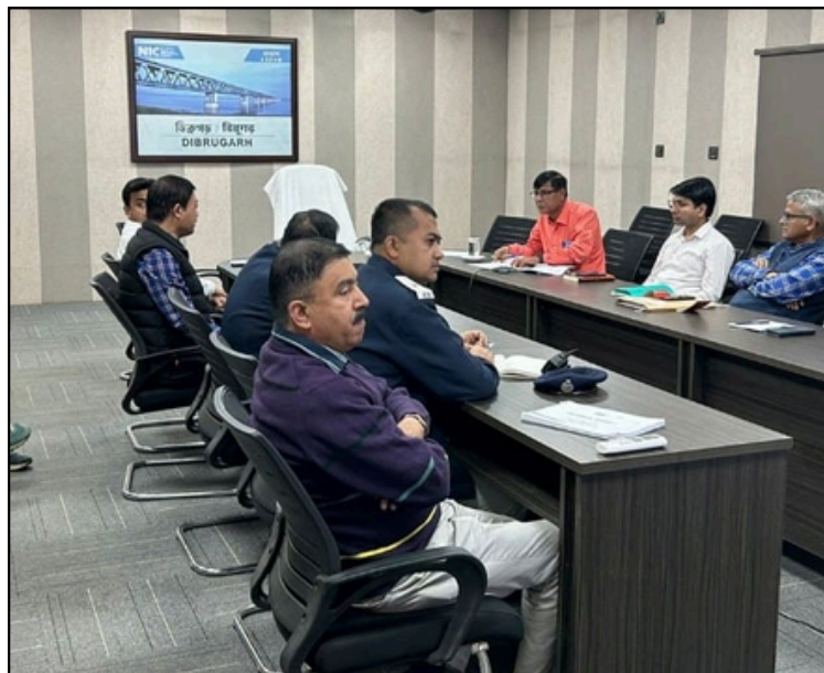
ডিব্ৰুগড়ত জিলা পথ সুৰক্ষা সমিতিৰ বৈঠকৰ এটি দৃশ্য, শনিবাৰে