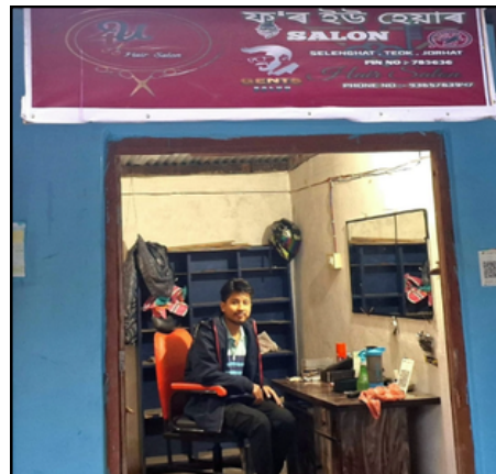
আছ নেতা হৈ পৰিল নাপিত, যোৰহাটত

■ বিশ্বৰ শতাধিক ৰাষ্ট্ৰলৈ আহি আছে ভয়ংকৰ বিপদ ■ ভাৰতকো সৰ্বস্বত্ব দিলে একাধিক প্ৰখ্যাত অৰ্থনীতিবিদে নিউয়ৰ্ক/পেৰিছ, ৩০ নৱেম্বৰঃ এক ভয়ংকৰ অৰ্থনৈতিক সংকটত জৰ্জৰ হৈ পৰিছে বিশ্বৰ শতাধিক ৰাষ্ট্ৰ! তীব্ৰ আৰ্থিক সংকটে ইতিমধ্যে হাহাকাৰ নমাই আনিছে শেষাংশ ৩ পৃষ্ঠাত