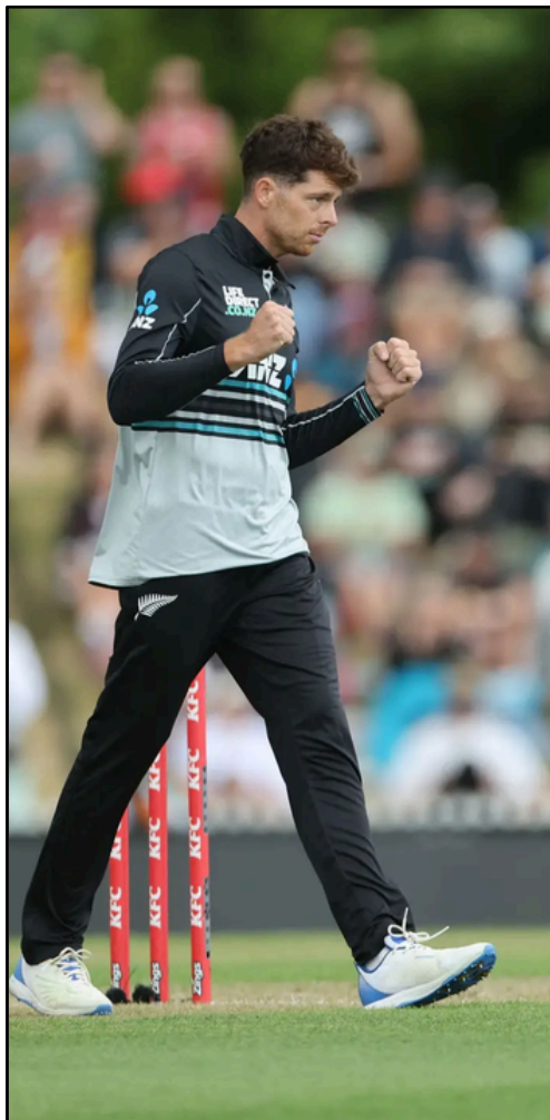
শ্ৰীলংকাৰ বিৰুদ্ধে নিউজিলেণ্ডৰ বলাৰ মিশ্বেল ছান্টাৰৰ উল্লাস, বুধবাৰে