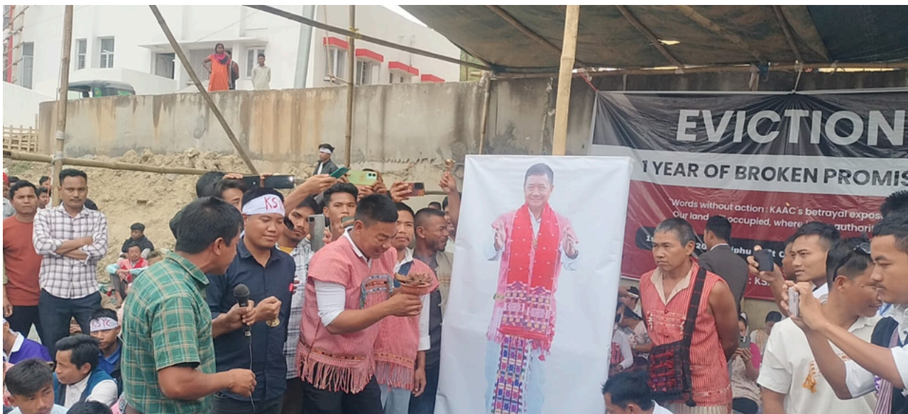
ডিফুত কাৰবি আংলঙৰ পি জি আৰ-ভি জি আৰৰ ভূমিত অবৈধ বেদখল উচ্ছেদৰ দাবীত প্ৰতিবাদ দল-সংগঠনৰ

ই-সংবাদ, মাজুলী, ১ মাৰ্চঃ জনসাধাৰণৰ মাজত অসংক্ৰামক ৰোগ হ্ৰাস কৰাৰ উদ্দেশ্যে ২০ ফেব্ৰুৱাৰী পৰা ৩১ মাৰ্চলৈকে সমগ্ৰ দেশৰ লগতে মাজুলীতো অসংক্ৰামক ৰোগৰ স্বাস্থ্য পৰীক্ষা অভিযান অনুষ্ঠিত কৰা হৈছে। এই বিশেষ অসংক্ৰামক ৰোগৰ স্বাস্থ্য পৰীক্ষা অভিযানে উচ্চ ৰক্তচাপ, মধুমেহ, মুখ, স্তন আৰু গৰ্ভাশয়, মুখৰ কেঞ্চাৰৰ পৰীক্ষাসমূহ সাঙুৰি ল'ব। ৩০ বছৰৰ ওপৰৰ লোকসকলে স্বাস্থ্য ৰক্ষাৰ সুবিধাৰ্থে ২০ ফেব্ৰুৱাৰী পৰা ৩১ মাৰ্চলৈকে চলিত অসংক্ৰামক ৰোগৰ স্বাস্থ্য পৰীক্ষা অভিযানত নিকটৱৰ্তী স্বাস্থ্য কেন্দ্ৰলৈ গৈ বিনামূলীয়াকৈ স্বাস্থ্য পৰীক্ষা কৰাৰ সুবিধা গ্ৰহণ কৰিব পাৰে। মাজুলী জিলা স্বাস্থ্য বিভাগৰ এ এন এম, আশা ছুপাৰভাইজাৰ আৰু আশাকৰ্মীসকলে গাঁওসমূহলৈ গৈ অসংক্ৰামক ৰোগৰ স্বাস্থ্য পৰীক্ষা কৰাব। মাজুলী জিলা স্বাস্থ্য বিভাগে চলিত অসংক্ৰামক ৰোগৰ অভিযানৰ সময়ছোৱাত জনসাধাৰণৰ সঁহাৰি কামনা কৰিছে।