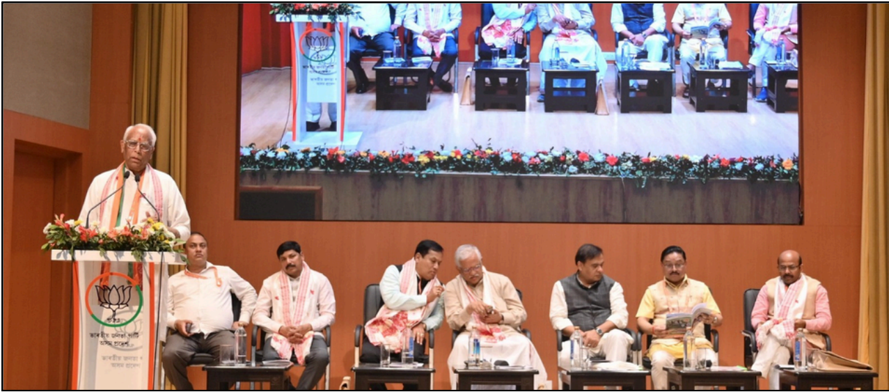
বিজেপিৰ বশিষ্ঠস্থিত মুখ্য কাৰ্যালয়ত বিশেষ সাংগঠনিক কৰ্মশালা, শনিবাৰে