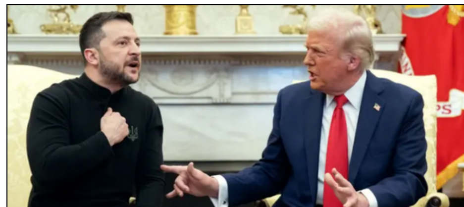
ট্ৰাম্পৰ অপমান! সমানে সমানে কথাৰে প্ৰত্যুত্তৰ ইউক্ৰেইনৰ ৰাষ্ট্ৰপতি জেলেনস্কিৰ

ই-সংবাদ, তিনিচুকীয়া, ১ মাৰ্চঃ তিনিচুকীয়া সদৰ আৰক্ষী থানাৰ ৫ পৃষ্ঠাত