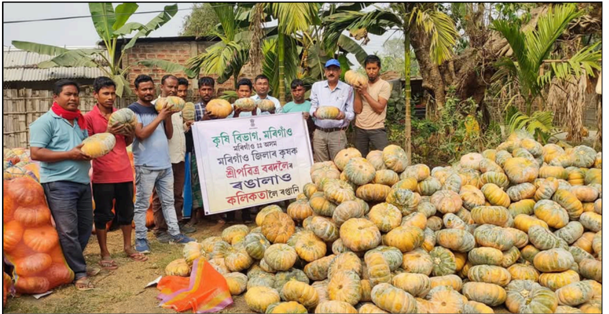
ৰঙালাও ৰপ্তানিৰে অভিলেখ গঢ়িছে মৰিগাঁৱৰ কৃষকে