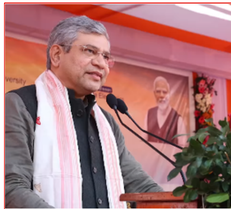
গুৱাহাটীত কেন্দ্ৰীয় মন্ত্ৰী অশ্বিনী বৈষ্ণৱ

নতুন দিল্লী, ৩ জানুৱাৰীঃ ২০২৩-২৪ বৰ্ষত সমগ্ৰ দেশৰ বিদ্যালয়সমূহত নামভৰ্তিৰ হাৰ বিগত বৰ্ষৰ তুলনাত ৩৭ লাখ হ্রাস পাইছে। ২০২২-২৩ বৰ্ষত নামভৰ্তি কৰা ছাত্ৰ- ছাত্ৰীৰ সংখ্যা আছিল ২৫.১৭ কোটি, আনহাতে ২০২৩-২৪ বৰ্ষৰ বাবে এই সংখ্যা ২৪.৮০ কোটি। এই শেৰাংশ ৫ পৃষ্ঠাত