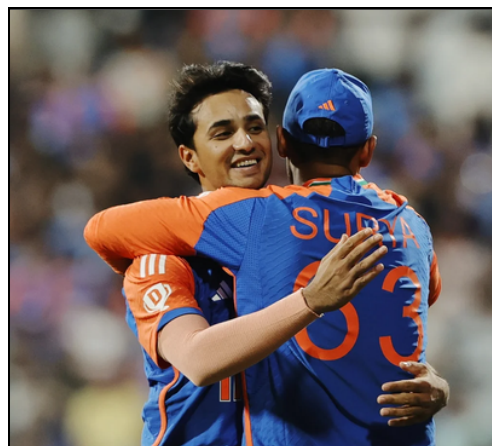
ক্ৰীড়াঙ্গণৰ আলিঙ্গন! ইংলেণ্ডৰ বিৰুদ্ধে টি-২০ত সূৰ্য-অভিষেক

ই-সংবাদ, বৰমা, ৩ ফেব্ৰুৱাৰীঃ নলবাৰী জিলাৰ ডিপ্তা সুবাদীৰ জৰীয়াপাৰা খেল পথাৰত মিলিজুলি যুৱ সংঘ আৰু স্থানীয় ৰাইজৰ সহযোগত অহা ৫ ফেব্ৰুৱাৰীৰ পৰা ৭ ফেব্ৰুৱাৰীলৈ তিনিদিনিয়াকৈ দিবা-নৈশ ক্ৰিকেট বল প্ৰতিযোগিতাৰ আয়োজন কৰা হৈছে। ইচ্ছুক প্ৰতিযোগীসকলে মাচুলসহ সমিতিৰ লগত যোগাযোগ কৰিব পাৰিব বুলি সমিতিয়ে জনাইছে। সমিতিয়ে জনোৱা মতে, প্ৰতিযোগিতাখনত প্ৰথম পুৰস্কাৰ হিচাপে থাকিব ৪০,০০০ টকাৰ লগতে ট্ৰফী আৰু দ্বিতীয় পুৰস্কাৰ হিচাপে থাকিব ২০,০০০ টকাৰ লগতে ট্ৰফী।