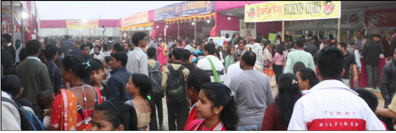
সাহিত্য সভাৰ পাঠশালা অধিবেশনৰ গ্ৰন্থমেলাত গ্ৰন্থপ্ৰেমীৰ ভিৰ, সোমবাৰে

তৎপৰ কেন্দ্ৰ চৰকাৰ, বে-আইনী সংগঠন ঘোষণা কৰা নহ'ব কিয়?