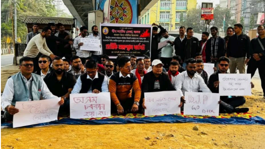
গ্ৰেপ্তাৰ কৰা ৭ নেতাক মুক্তিৰ দাবীত গুৱাহাটীত বীৰ লাচিত সেনাৰ অৱস্থান ধৰ্মঘট