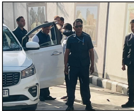
লোকে দেখুৱাই কেটেৰা-জেডেৰা, ভিতৰি...

■ এটা বছৰতে ৫৪ শতাংশ পৰ্যন্ত বৃদ্ধি পালে বায়ু প্ৰদূষণ, ৫ বছৰত সৰ্বাধিক পংকজ তৰণ, ৩ মাৰ্চঃ ফাগুনৰ বতৰত এনেয়েই আকাশ ধূলিয়ৰি। তাতে আকৌ বায়ু প্ৰদূষণে একপ্ৰকাৰ নৰকসদৃশ কৰি তুলিছে মহানগৰবাসীৰ জীৱন। দ্বিতীয় পৃষ্ঠাত চাওক