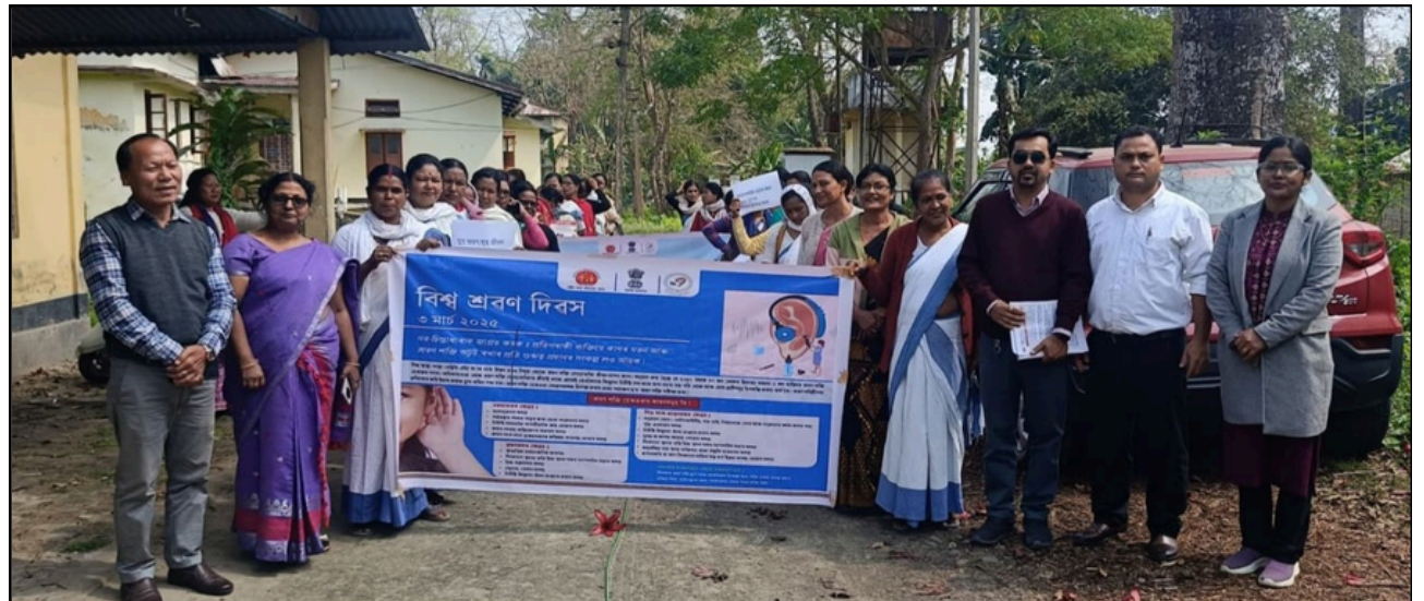
মাজুলীত বিশ্ব শ্ৰৱণ দিবস উপলক্ষে সজাগতা ৰেলী, ফটোঃ ই-সংবাদ, মাজুলী

একাংশই বিষাক্ত ৰাসায়নিক দ্ৰব্য মিহলি কৰি নিশাটোৰ ভিতৰতে ৰং-চঙীয়া কৰি তোলে। জানিব পৰা মতে, এনে ফল-মূলসমূহ অসাধু ব্যৱসায়ীসকলে লাভালাভৰ বাবে কেলচিয়াম কাৰ্বাইড নামৰ মাৰাত্মক ৰাসায়নিক দ্ৰব্য দি নিশাটোৰ ভিতৰতে পকাই লয়। আৰু সেইবোৰ পুৰা চক বজাৰত ভিটামিনযুক্ত ফল-মূল হিচাপে গ্ৰাহক ৰাইজক বিক্ৰী কৰে। বজাৰত উপলব্ধ এনেবোৰ ফল-মূল খালে মানুহৰ স্বাস্থ্যৰ প্ৰতি ভাবুকি আহিব পাৰে। যি কথা কোনেও এবাৰলৈ চিন্তা নকৰে। বজাৰৰ পৰা কোনো ফল ক্ৰয় কৰি নিয়াৰ এদিন পাছতে ফলবোৰ গেলি যাবলৈ ধৰে। এয়ে ৰাসায়নিক দ্ৰব্য মিহলিৰ এক প্ৰমাণ। বজাৰত উপলব্ধ এনে বস্তুসমূহ মানুহে খোৱাৰ উপযুক্ত হয়নে নহয় তাক পৰীক্ষণ কৰিবলৈ জিলাত যোগান বিভাগ আছে যদিও বিভাগৰ যেন এইবোৰলৈ কোনো প্ৰক্ষেপ নাই।