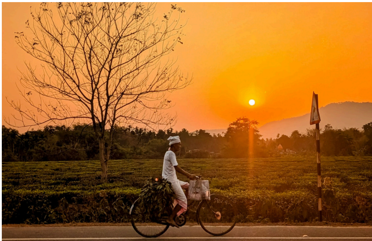
ফাগুনৰ লঠঙা বাটেৰে বেলিটো বুকুত সামৰি ঘৰমূৰা এটি উশাহ!