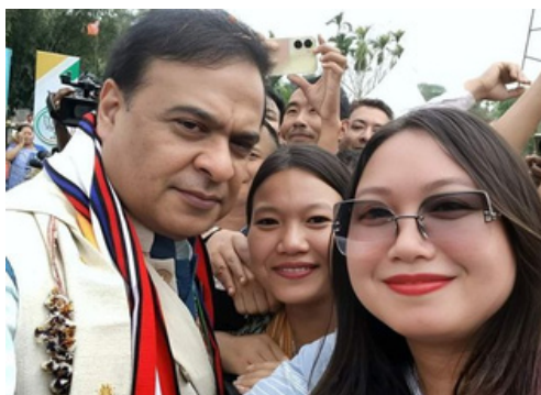
মুখ্যমন্ত্ৰীয়ে ছচিয়েস মিডিয়াত শ্বেয়াৰ কৰিলে বিশেষ ছেলফি