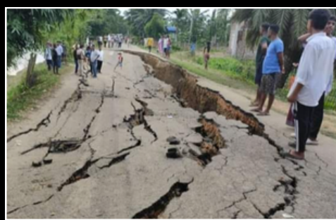
নগাঁৱৰ কামপুৰত পথৰ দুৰৱস্থা

ই-সংবাদ, ৩ অক্টোবৰঃ প্ৰায় ৩৭ হাজাৰ কোটি টকা ঠিকাদাৰক প্ৰাপ্য ধন আদায় দিবলৈ আছে অসম চৰকাৰে। এই তথ্য প্ৰকাশ কৰিছে সদৌ অসম ঠিকাদাৰ সন্থাৰ একাংশ বিষয়া-কৰ্মচাৰীয়ে। সন্থাৰ সূত্ৰটোৰ অভিযোগ, জলজীৱন মিছনৰ কোনো বিল