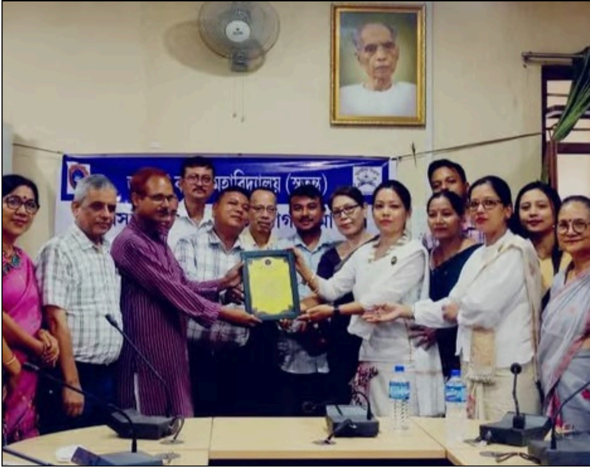
জে বি কলেজত টাই ভাষাৰ কৰ্মশালাৰ সফল সামৰণি