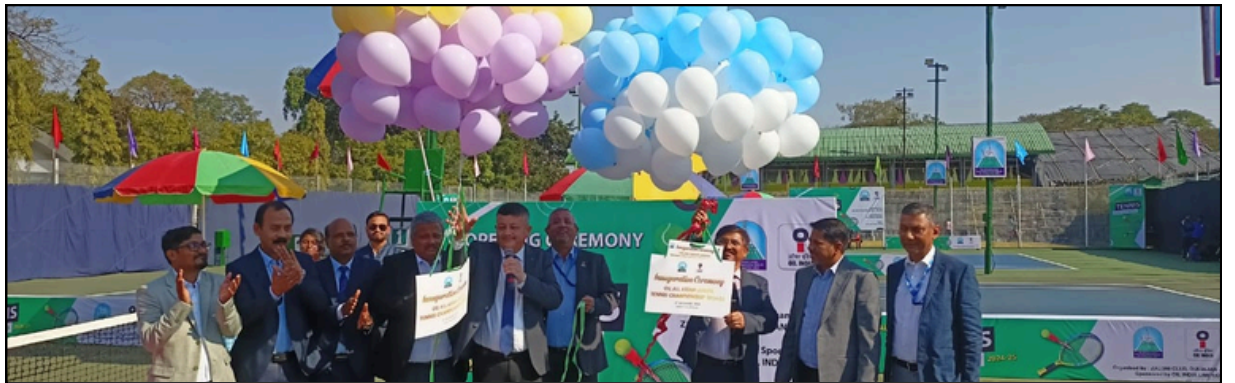
দুলীয়াজানত অইল সদৌ অসম টেনিছ চেম্পিয়নশ্বিপৰ উদ্বোধনী অনুষ্ঠানৰ এটি মুহূৰ্ত, মঙলবাৰে