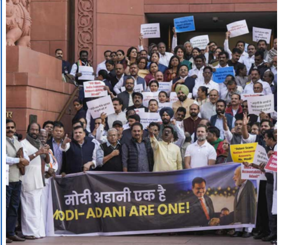
আদানি কাণ্ডক লৈ বিৰোধীৰ প্ৰতিবাদ, মঙলবাৰে

ই-সংবাদ, ৩ ডিচেম্বৰঃ বাংলাদেশত হিন্দুৰ ওপৰত সম্প্ৰতি শেষাংশ ২ পৃষ্ঠাত