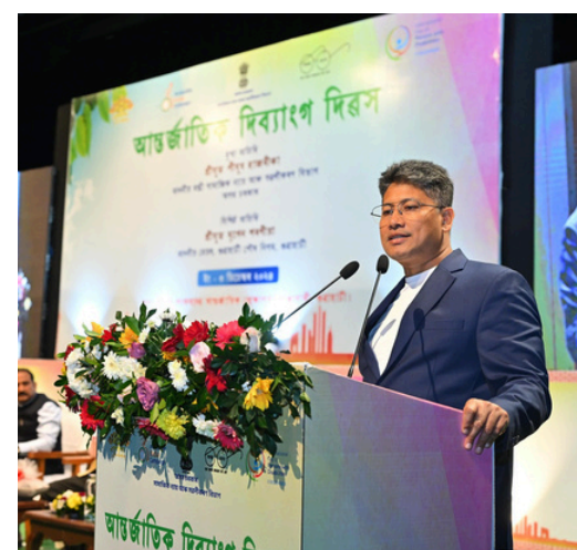
শংকৰদেৱ কলাক্ষেত্ৰত আয়োজিত দিব্যাংগ দিৱসত মন্ত্ৰী পীযুষ হাজৰিকা