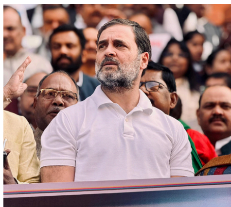
লক্ষ্য ক'ত? সদনৰ সন্মুখত এনেকৈয়ে দেখা গল ৰাছল গান্ধীক