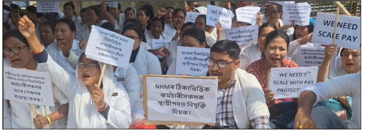
সোণাৰিত এন এইচ এম কৰ্মচাৰীৰ কৰ্ম বিৰতি কাৰ্যসূচীৰ কিয়দংশ, ফটোঃ ই-সংবাদ, সোণাৰি

দাম পূৰ্বৰ তুলনাত দুই-তিনিগুণ পৰ্যন্ত বৃদ্ধি পোৱাত মুৰে-কপালে হাত দিবলৈ বাধ্য হৈছে সাধাৰণ শ্ৰেণীৰ গ্ৰাহক। কাৰণ ৰমজানৰ ৰোজাৰ বতৰত মুছলমান লোকসকলে কম-বেছি পৰিমাণে হ'লেও ইফতাৰৰ বাবে বিভিন্ন তৰহৰ ফল-মূল ক্ৰয় কৰে। কিন্তু সম্প্ৰতি গ্ৰাহকসকলে ফল-মূল কিনিবলৈ গৈ ফলৰ বজাৰত দাম শূনি থমকি ৰ'বলগীয়াত পৰিছে। পৰিণতিত এনেদৰে ৰমজানৰ ৰোজাৰ গহীনা লৈ ফল-মূলৰ দৰ এচাম ধুবন্ধৰ ব্যৱসায়ীয়ে কৃত্ৰিম নাটনিৰে আকাশলংঘী কৰাত নগএণ দৰিদ্ৰ আৰু নিম্ন মধ্যবিত্ত শ্ৰেণীৰ ৰোজাদাৰে ইফতাৰ পালিবলৈ গৈ চকুয়ে ধোঁৱা-কোঁৱা দেখিছে। এক কথাত পৱিত্ৰ ৰমজানৰ ৰোজাৰ দিনকেইটাত ইফতাৰৰ আহাৰ পৰম হেঁপাহেৰে খাবলৈ গৈ দৰিদ্ৰ নগএণ লোকসকলে পিছহঁকি আহিবলৈ বাধ্য হৈছে একমাত্ৰ ফল-মূলৰ অভাৱনীয় মূল্যবৃদ্ধিৰ কাৰণে। সেয়ে অসাধু ব্যৱসায়ীৰ এনে দামবৃদ্ধি নিয়ন্ত্ৰণৰ বাবে জিলা প্ৰশাসনক কাৰ্যকৰী পদক্ষেপ গ্ৰহণৰ দাবী জনাইছে ভুক্তভোগী লোকসকলে।