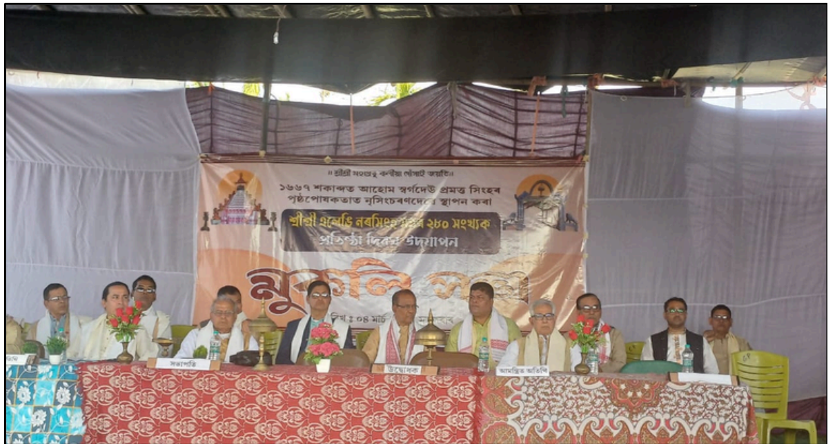
মাজুলীৰ শ্ৰীশ্ৰী ব্ৰহ্মাণ্ড নৰসিংহ সত্ৰৰ ২৮০ সংখ্যক প্ৰতিষ্ঠা দিৱস উপলক্ষে অনুষ্ঠিত মুকলি সভাৰ দৃশ্য

কৰ্মৰত ঠিকান্তিক কৰ্মচাৰীসকলৰ বাবে পেঞ্চনৰ ব্যৱস্থা কৰক, সমান কামৰ সমান মজুৰি আদায় দিয়ক, পে' স্কেল প্ৰদান কৰক, আদি প্ৰদান দি পৰিৱেশ উত্তাল কৰি তোলে। উল্লেখযোগ্য যে ৰাষ্ট্ৰীয় স্বাস্থ্য অভিযান অসমৰ অধীনত প্ৰায় ২৪ হাজাৰ বিষয়া-কৰ্মচাৰী ৰাজ্যৰ স্বাস্থ্যখণ্ডৰ বিভিন্ন পদত ২০০৬ চনৰপৰাই সেৱা আগবঢ়াই আহিছে যদিও নিম্নতম দৰমহাৰে পৰিয়াল পোহপাল দিয়াত অসুবিধাৰ সন্মুখীন হৈছে। মুখ্যমন্ত্ৰী ডঃ হিমন্ত বিশ্ব শৰ্মা ২০১৬ চনত স্বাস্থ্যমন্ত্ৰী হৈ থকা অৱস্থাত এন এইচ এম কৰ্মচাৰীৰ ঠিকান্তিক চাকৰি নিয়মীয়াকৰণ কৰা হ'ব বুলি কৈছিল যদিও তেখেতৰ চৰকাৰ চলি থকা সময়তো চাকৰি নিয়মীয়াকৰণ নহ'ল বুলি ক্ষোভ উজাৰিছে কৰ্মচাৰীসকলে। তেওঁলোকৰ দাবী পূৰণ নহ'লে আগন্তুক দিনত ভয়াৱহভাৱে ৰাজ্যব্যাপী গণ আন্দোলন গঢ়ি তুলিব বুলি হুঁকাৰ প্ৰদান কৰে।