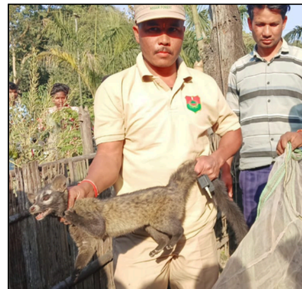
ডিমাকুছিত উদ্ধাৰ হোৱা আঘাতপ্ৰাপ্ত জহামালাটো