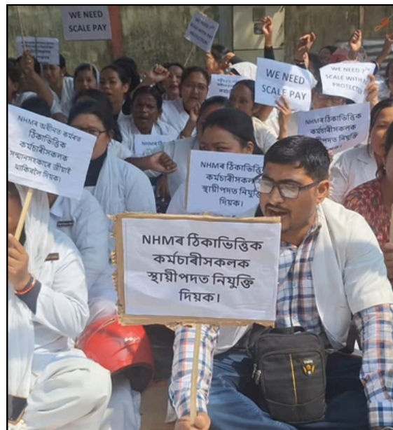
সোণাৰিত এনএইচএম কৰ্মচাৰীৰ কৰ্মবিৰতি