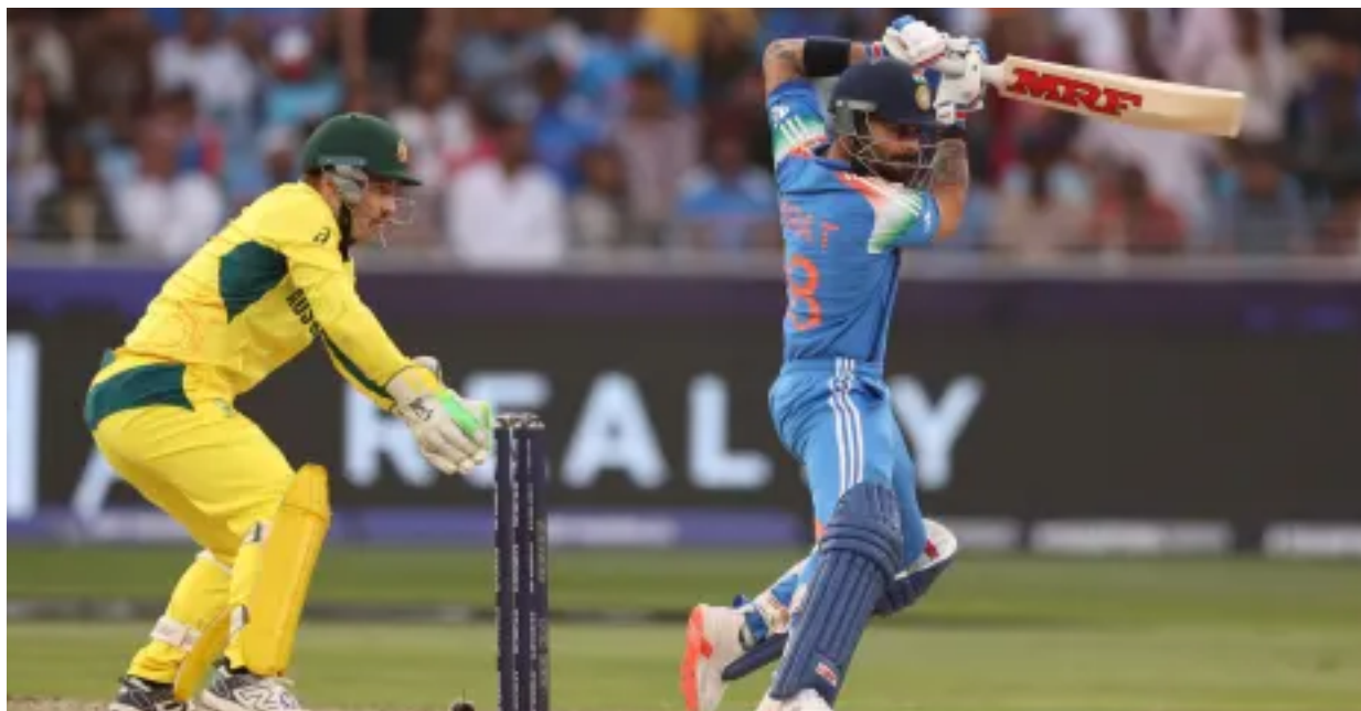
ডুৱাইত অনুষ্ঠিত চেম্পিয়নছ ট্ৰফীৰ ছেমিফাইনেলত অষ্ট্ৰেলিয়াৰ বিৰুদ্ধে এটা দৰ্শনীয় শ্বট বিৰাট কোহলিৰ

কোহলি-ছামীৰ দুৰ্দান্ত প্ৰদৰ্শনেৰে ছেমিতো অপ্ৰতিৰোধ্য টীম ইণ্ডিয়া