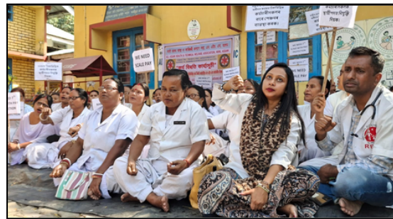
ৰাজ্যজুৰি স্বাস্থ্য কৰ্মীৰ প্ৰতিবাদ, ফটোঃ ই-সংবাদ, গোলকগঞ্জ

নতুন দিল্লী, ৪ মাৰ্চঃ ৰাজ্য চৰকাৰৰ ব্যৰ্থতাৰ বাবেই ক্ৰমাৎ ব্যক্তিগত খণ্ডৰ হাস্পতালৰ হাতলৈ গৈছে দেশৰ স্বাস্থ্য আন্তঃগাঁথনি। সাধাৰণ জনতাৰ বাবে চিকিৎসা ব্যয় ডাঙৰ চিন্তাৰ কাৰণ হৈ পৰিছে, অথচ এই সন্দৰ্ভত শেষাংশ ২ পৃষ্ঠাত