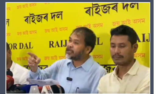
■ ৰাইজৰ দলৰ কাৰ্যালয়ত সংবাদমেল