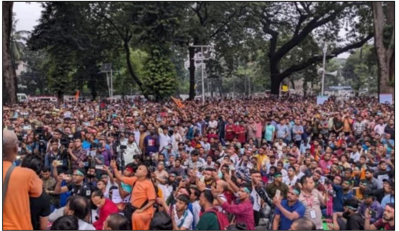
বাংলাদেশত অধিক হৈ পৰা হিন্দু নিৰ্যাতনৰ বিৰুদ্ধে ঢাকাৰ শ্বহীদ মিনাৰত এনেদৰে লাখ লাখ হিন্দুৰ সমাৰেশ