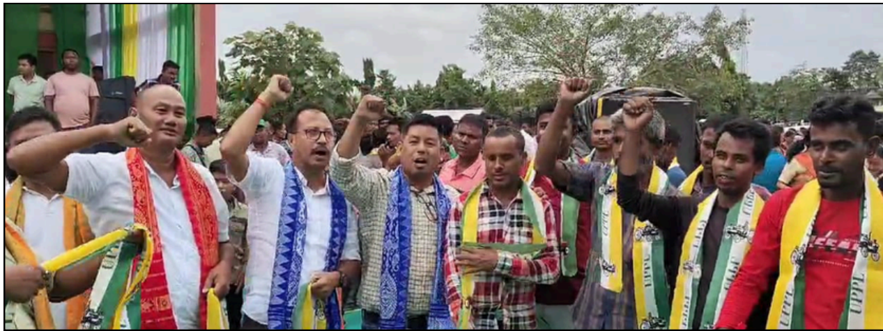
বনৰগাঁৱত ইউপিপিএলৰ বিশাল যোগদান কাৰ্যসূচীত দলটোৰ একাংশ সমৰ্থক