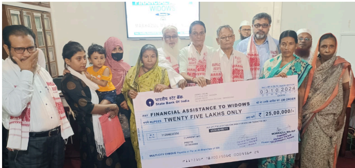
দুৰ্গা পূজাৰ প্ৰাকক্ষণত আটেশ বিধৱা মহিলালৈ মৰ্কজুল মাআৰিফৰ ২৫ লাখ টকা সাহায্য বিতৰণ, হোজাইত