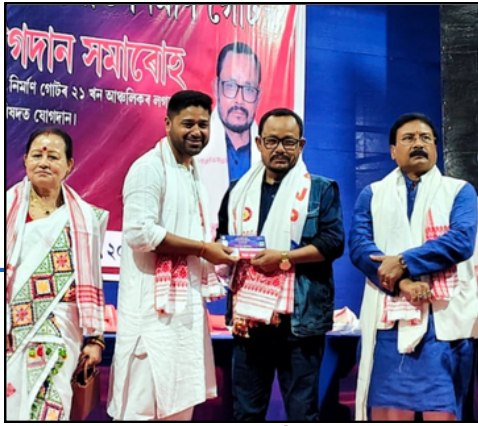
■ অজাপত যোগদান জিতেন গগৈৰ

ই-সংবাদ, ৪ অক্টোবৰঃ ২০২৬ৰ বিধানসভা নিৰ্বাচনত বিজেপিক পৰাভূত কৰিবৰ বাবে সন্মিলিত বিৰোধীয়ে এইবাৰ ককালত টঙালি বান্ধিছে। কংগ্ৰেছৰ নেতৃত্বত ১৮টা ৰাজনৈতিক দলে এইবাৰ বিৰোধী ঐক্য মঞ্চৰ নাম সলনি কৰি অসম সন্মিলিত মৰ্চা চমুকৈ 'অসম' নামেৰে নতুনকৈ নামাকৰণ কৰিবলৈ সিদ্ধান্ত গ্ৰহণ কৰিছে। এই সন্দৰ্ভত বিৰোধী দলসমূহৰ শেষাংশ ২ পৃষ্ঠাত