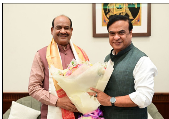
লোকসভাৰ অধ্যক্ষক সাক্ষাত কৰিলে অসমৰ মুখ্যমন্ত্ৰীয়ে, ফটো বুধবাৰৰ