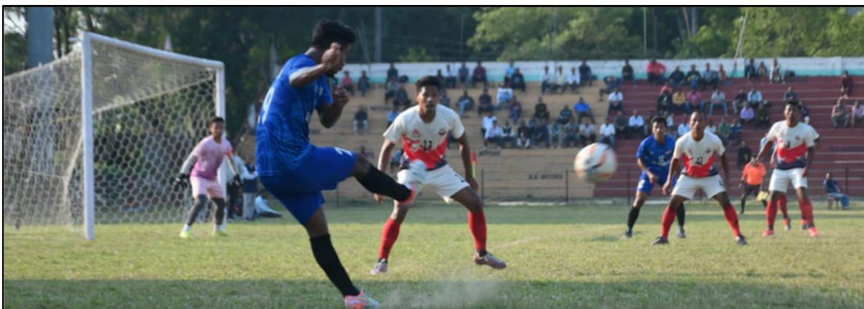
৭৬ সংখ্যক স্বাধীনতা দিৱস কাপ ফুটবল প্ৰতিযোগিতাৰ বুধবাৰৰ খেলৰ এটি উত্তেজনাপূৰ্ণ মুহূৰ্ত, নগাঁৱত