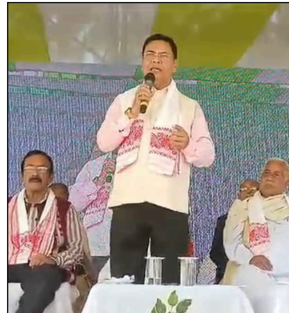
মুছলপুৰত অসম জ্যেষ্ঠ নাগৰিক কল্যাণ পৰিষদৰ সভাৰ এটি মুহূৰ্ত