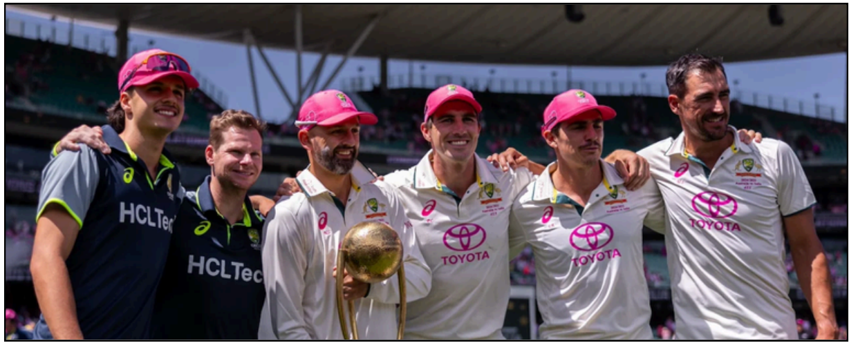
ভাৰতক পৰাভূত কৰি বৰ্ডাৰ-গাভাস্কাৰ ট্ৰফী জয় অষ্ট্ৰেলিয়াৰ, দেওবাৰে ছিডনী ক্ৰিকেট গ্ৰাউণ্ডত