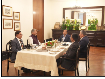
উদ্যোগপতিক সাক্ষাৎ মুখ্যমন্ত্ৰীৰ

ই-সংবাদ, ৫ জানুৱাৰীঃ চৰকাৰী কাৰ্যসূচী লৈ মুস্বাহিত ভ্ৰমণৰত মুখ্যমন্ত্ৰী হিমন্ত বিশ্ব শৰ্মাই এডভাণ্টেজ আছাম ২.০ত শেষাংশ ২ পৃষ্ঠাত