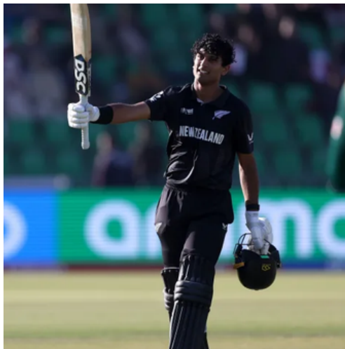
চেম্পিয়নছ ট্ৰফীৰ ছেমিফাইনেলত দক্ষিণ আফ্ৰিকাৰ বিৰুদ্ধে শতক নিউজিলেণ্ডৰ ৰবীন্দ্ৰৰ