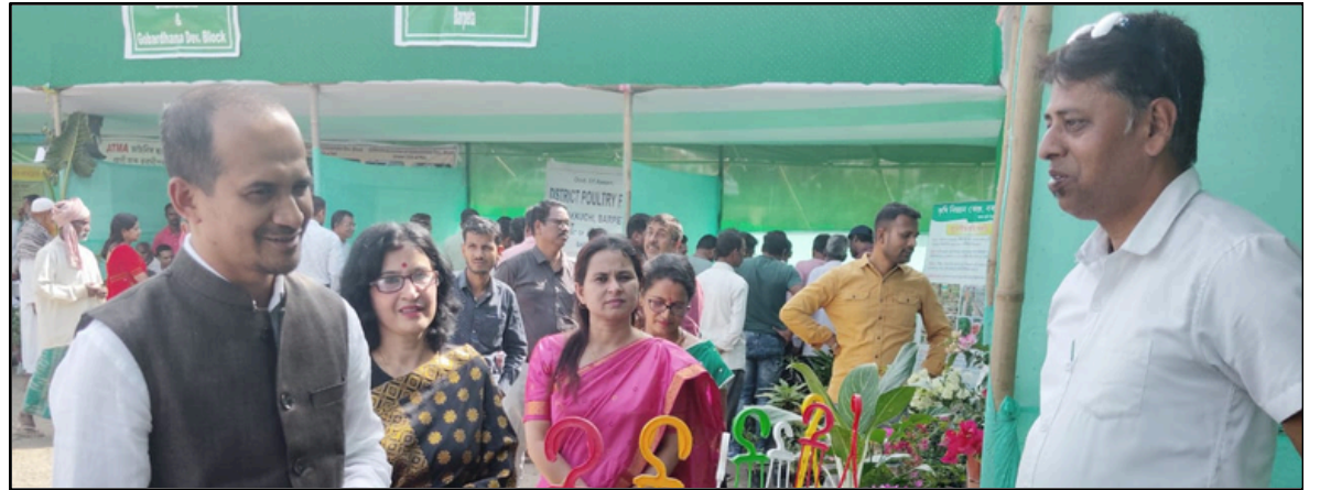
বৰপেটা জিলাৰ বাৰাডীত অনুষ্ঠিত কৃষক প্ৰদৰ্শনীৰ এক দৃশ্য