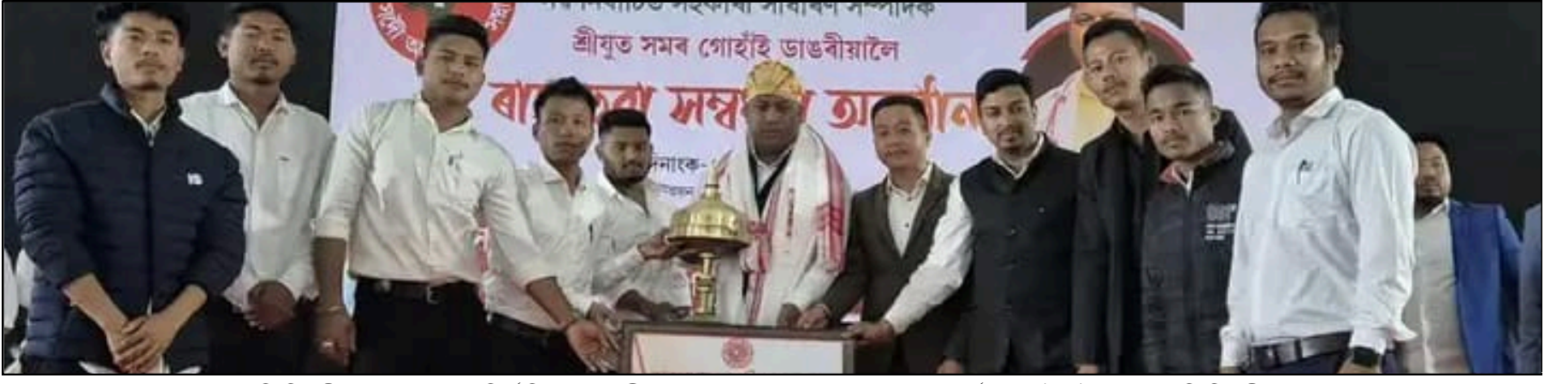
তিনিচুকীয়াত আছৰ নৰনিৰ্বাচিত সহকাৰী সাধাৰণ সম্পাদকক ৰাজহুৱা সন্মৰ্দ্ধনা, ফটোঃ ই-সংবাদ, তিনিচুকীয়া