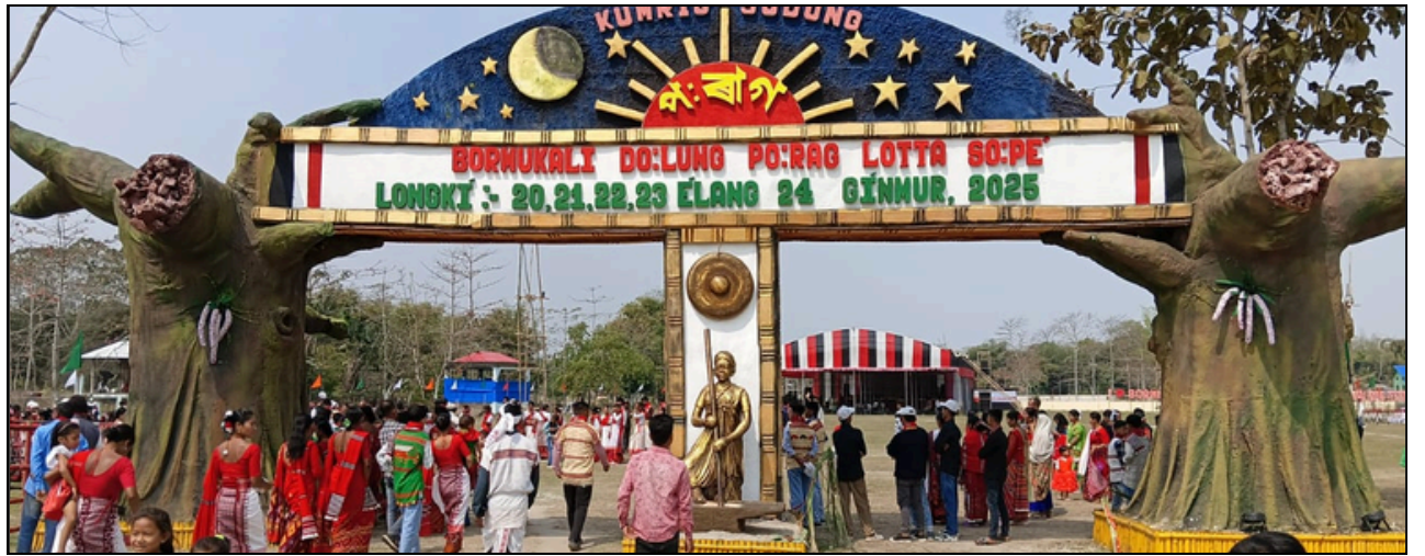
যোৰহাটৰ বৰমুকলিত প:ৰাগ উৎসৱ আৰম্ভ