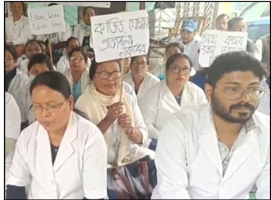
লাহোৱালত স্বাস্থ্যকৰ্মীৰ প্ৰতিবাদ অব্যাহত