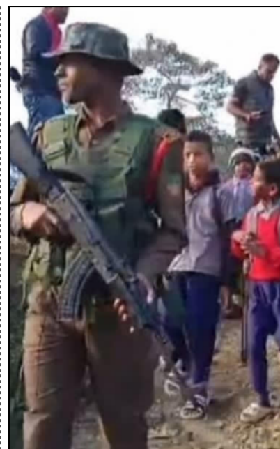
বাঘৰ আতংকৰ পিছত এইদৰে নিৰাপত্তাৰক্ষীৰ নিৰাপত্তাৰে কলিয়াবৰত গুণোৎসৱ

ই-সংবাদ, ৬ জানুৱাৰীঃ চীনৰ বিৰুদ্ধে বিজেপি দল আৰু চৰকাৰে মাত মাতিব নোৱাৰে বুলি কৈ বিজেপিয়ে চীনৰ বিৰুদ্ধে নৰম স্থিতি ৪ পৃষ্ঠাত চাওক