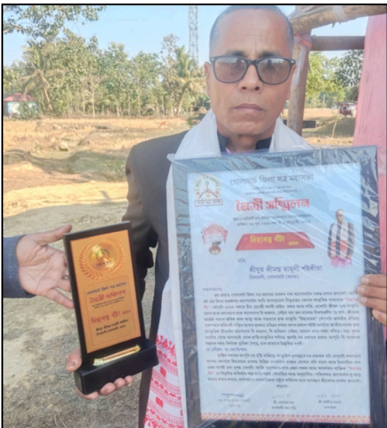
অসম সত্ৰ মহাসভাৰ মৈত্ৰী সন্মিলনৰ এটি মুহূৰ্ত, ফটোঃ ই-সংবাদ, খুমটাই