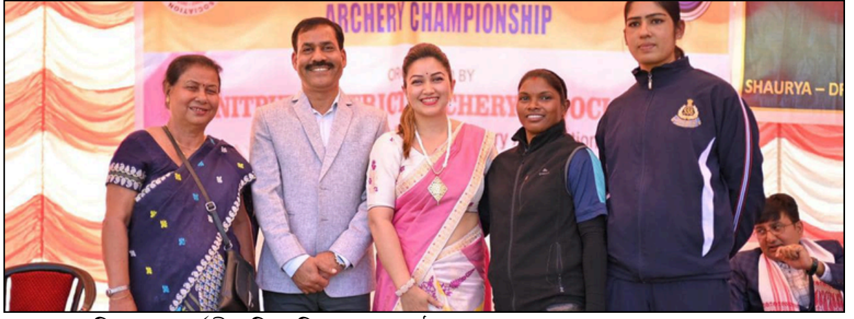
শোণিতপুৰত আৰ্চাৰী প্ৰতিযোগিতাৰ এক অনুষ্ঠানত এনেদৰে দেখা গ'ল আঙুৰলতা ডেকাক