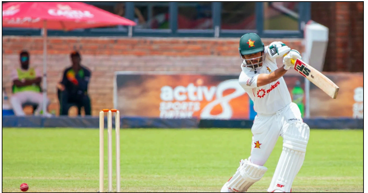
আফগানিস্তানৰ বিৰুদ্ধে বুলৱায়ুত চলি থকা দ্বিতীয় টেষ্টত জিহাৰ'ৱেৰ চিকন্দৰ ৰাজাৰ দৰ্শনীয় ষ্ট্ৰ'ক