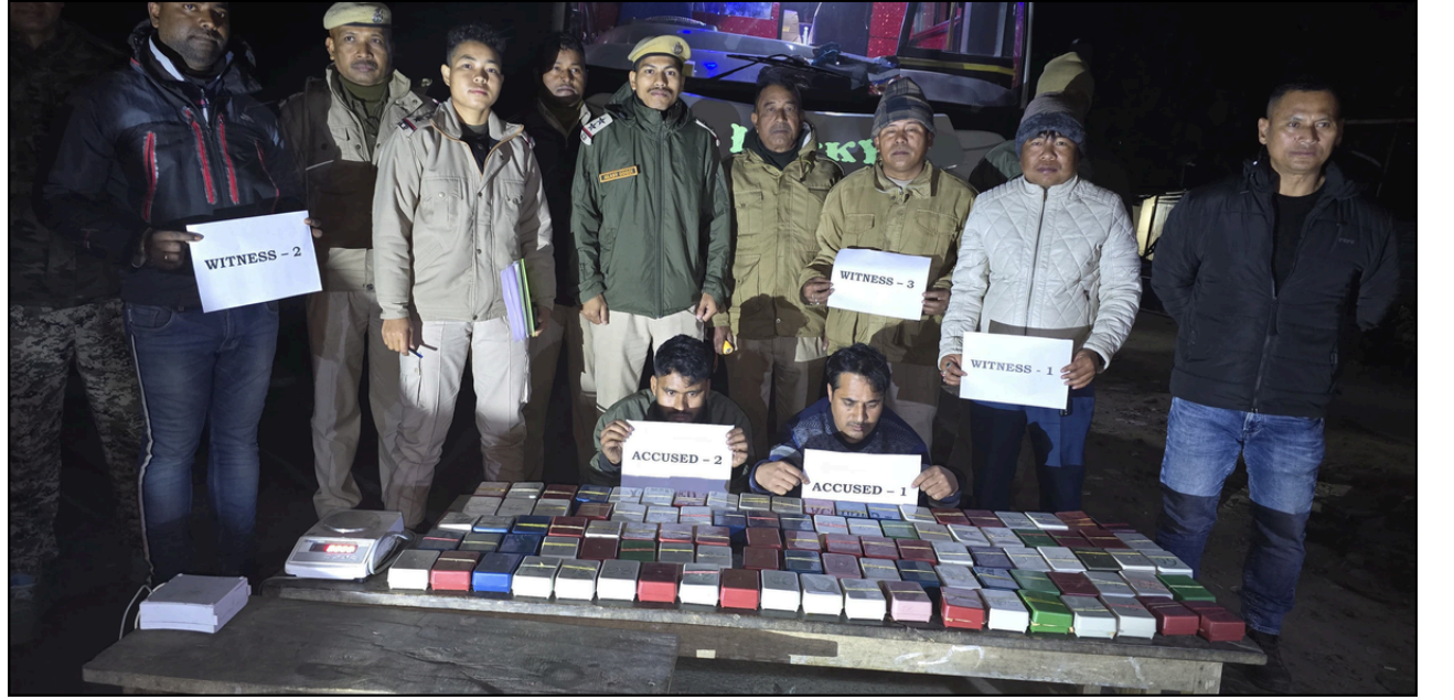
ডিলাইত নৈশ বাছৰ পৰা জব্দ ৯ কোটি টকাৰ হেৰ'ইন, চালক-হেণ্ডিমেণ গ্ৰেপ্তাৰ