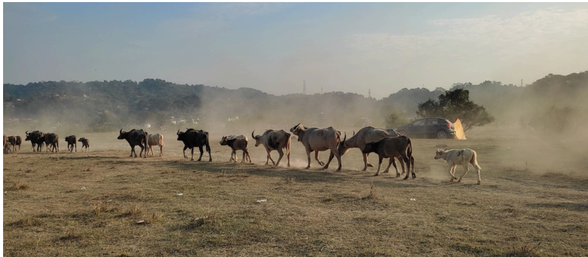
গধূলি পৰত মহানগৰীৰ নিচেই সমীপত এইদৰে ধূলি উৰুৱাই ঘৰমুৱা এজাক ম'হ