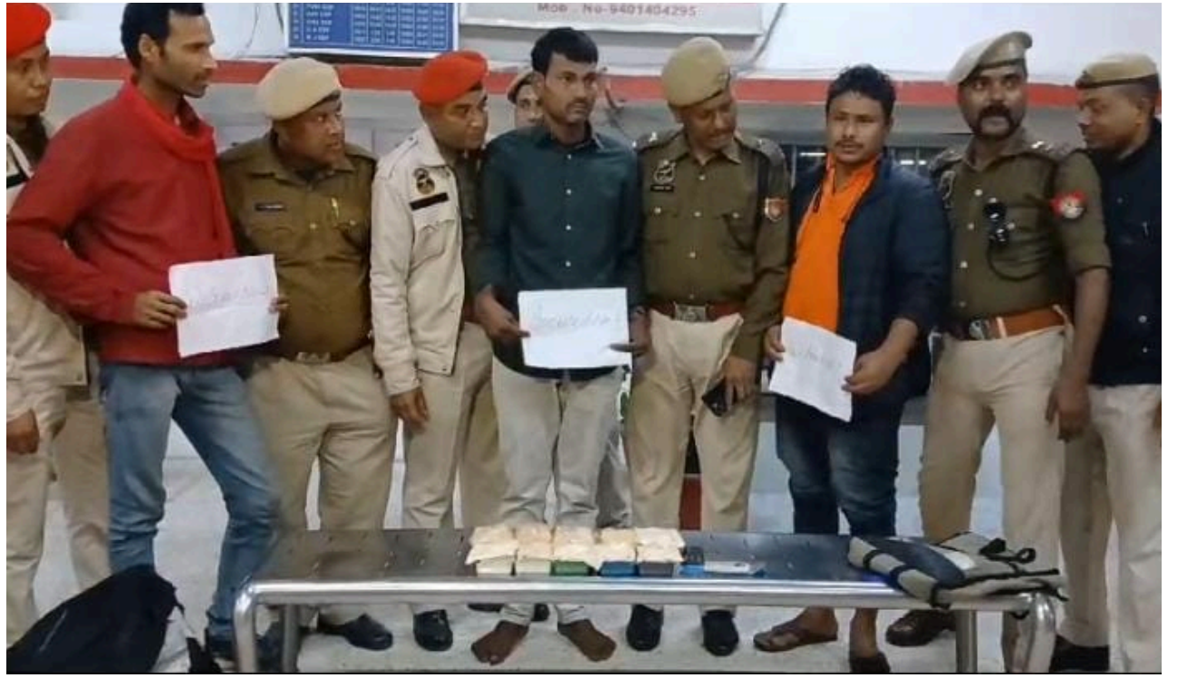
ৰঙিয়াত বৃহৎ পৰিমাণৰ ড্ৰাগছসহ আটক বহিঃৰাজ্যৰ সৰবৰাহকাৰী, ফটোঃ ই-সংবাদ, ৰঙিয়া

ড্ৰাগছসহ লোকজনক আটক কৰে আৰক্ষীয়ে। বদৰপুৰৰ পৰাই লোকমান্য তিলক ৰে'লযোগে বিহাৰলৈ বুলি আহিছিল লোকজন। আটকাধীন লোকজনৰ পৰা দহটা চাবোনৰ বাকচত ১১২ গ্ৰাম সন্দেহযুক্ত ড্ৰাগছ জব্দ কৰে ৰে'ল আৰক্ষীয়ে। আনহাতে, জব্দ কৰা ড্ৰাগছখিনিৰ বজাৰ মূল্য ২২ লক্ষাধিক টকা বুলি নিশ্চিত কৰে আৰক্ষীয়ে।