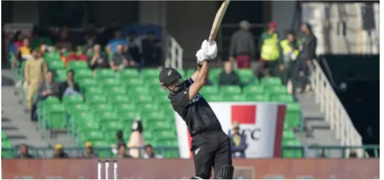
লাহোৰত অনুষ্ঠিত ত্ৰিদেশীয় শৃংখলাত পাকিস্তানৰ বিৰুদ্ধে নিউজিলেণ্ডৰ ডেবেল মিছেলৰ দৰ্শনীয় ষ্ট