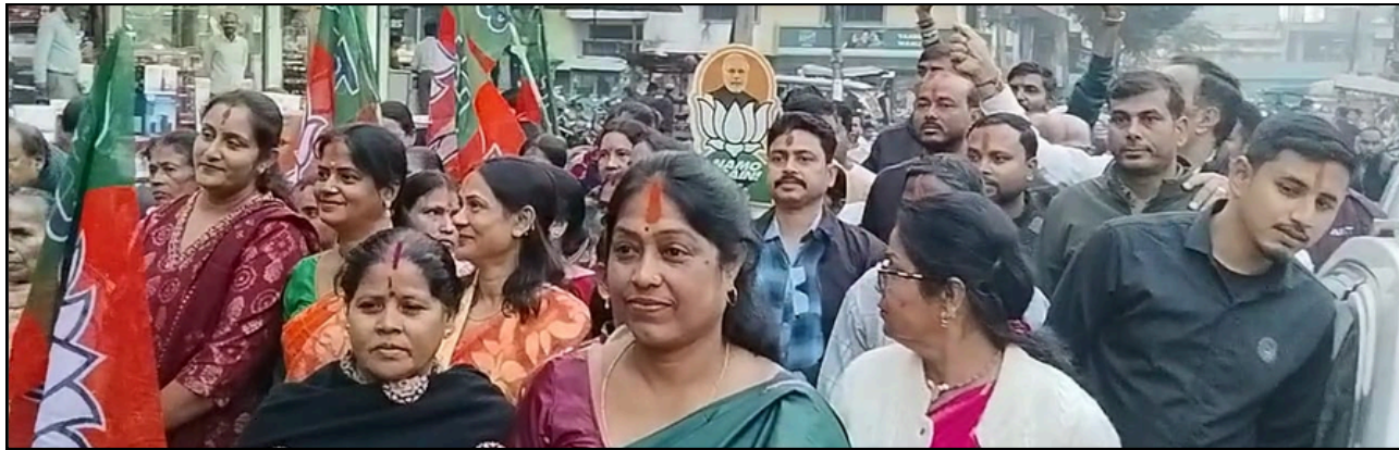
দিল্লীত বিজেপিৰ জয়ৰ পিছতে বৰপেটাৰোডত বিজেপিৰ বিজয় উৎসৱ পালন