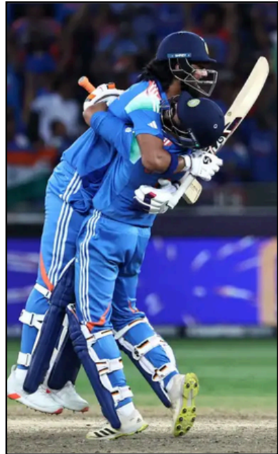
বিজয়ৰ আলিঙ্গন! জয়ৰ পিছত কে এল ৰাহুল আৰু ৰবীন্দ্ৰ জাদেজা

দামাস্কাছ, ৯ মাৰ্চঃ ছিৰিয়াৰ পৰা পুনৰ পোহৰলৈ আহিছে ভয়ংকৰ হিংসাৰ বক্তাক্ত দৃশ্য। গাদীচ্যুত ৰাষ্ট্ৰপতি বাছাৰ আল আছাদৰ সমৰ্থক আৰু ৭ পৃষ্ঠাত চাওক