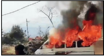
পুনৰ অগ্নিগৰ্ভা মণিপুৰ, দেওবাৰে

অঘটন! মুম্বাইত ৪ শ্রমিকৰ শ্বাসৰুদ্ধ মৃত্যু মুম্বাই, ৯ মাৰ্চঃ মুম্বাইত নিৰ্মাণৰত এটা অট্টালিকাৰ পানীৰ টেংকি চাফা কৰি থকা শেষাংশ ৯ পৃষ্ঠাত