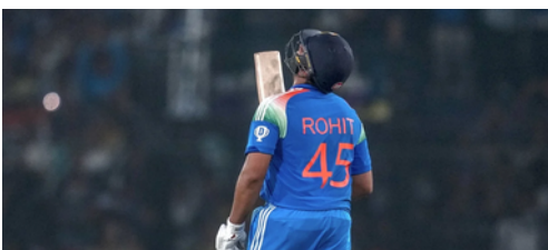
ইংলেণ্ডৰ বিৰুদ্ধে শতক অৰ্জনৰ পিছত পেভিলিয়নমুখী ৰোহিত শৰ্মা