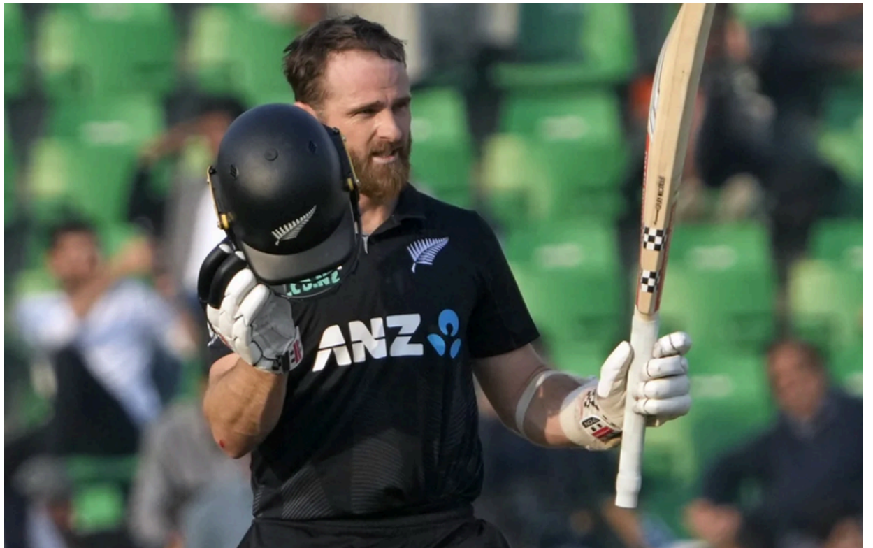
লাহোৰত অনুষ্ঠিত ত্ৰিদেশীয় শৃংখলাত দক্ষিণ আফ্ৰিকাৰ বিৰুদ্ধে শতকীয় ইনিংছ নিউজিলেণ্ডৰ কেন উইলিয়ামছনৰ

অৱশেষত অন্ত পৰিল তাৰকা কেন উইলিয়ামছনৰ শতকৰ খৰাং