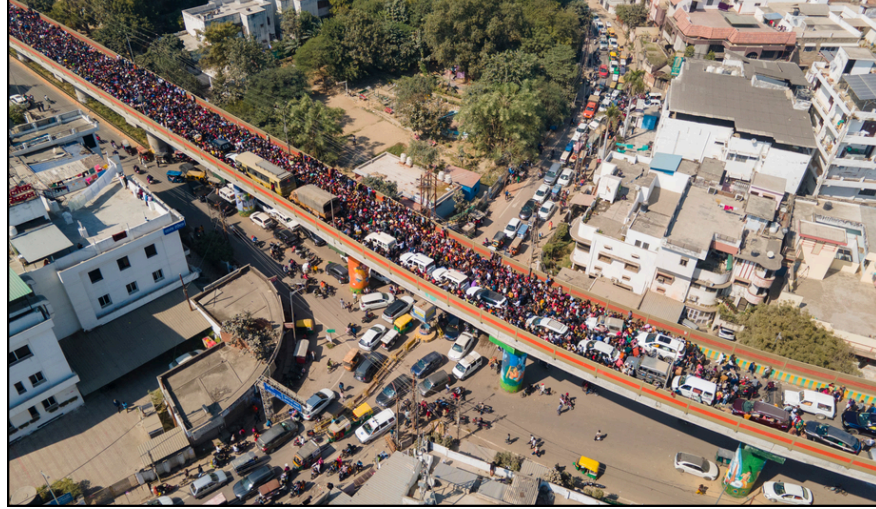
মহাকুস্তলৈ যোৱা পথত এতিয়া ভীষণ যান-জট, পুণ্যাৰ্থীৰ হাহাকাৰ

ই-সংবাদ, ১০ ফেব্ৰুৱাৰীঃ প্ৰতিবাদ, মিছিল আদি কঠোৰ হাতেৰে দমন কৰিবলৈ সাজু হৈছে অসম চৰকাৰ। এডভাৰ্টেজ আছাম ৪ পৃষ্ঠাত চাওক