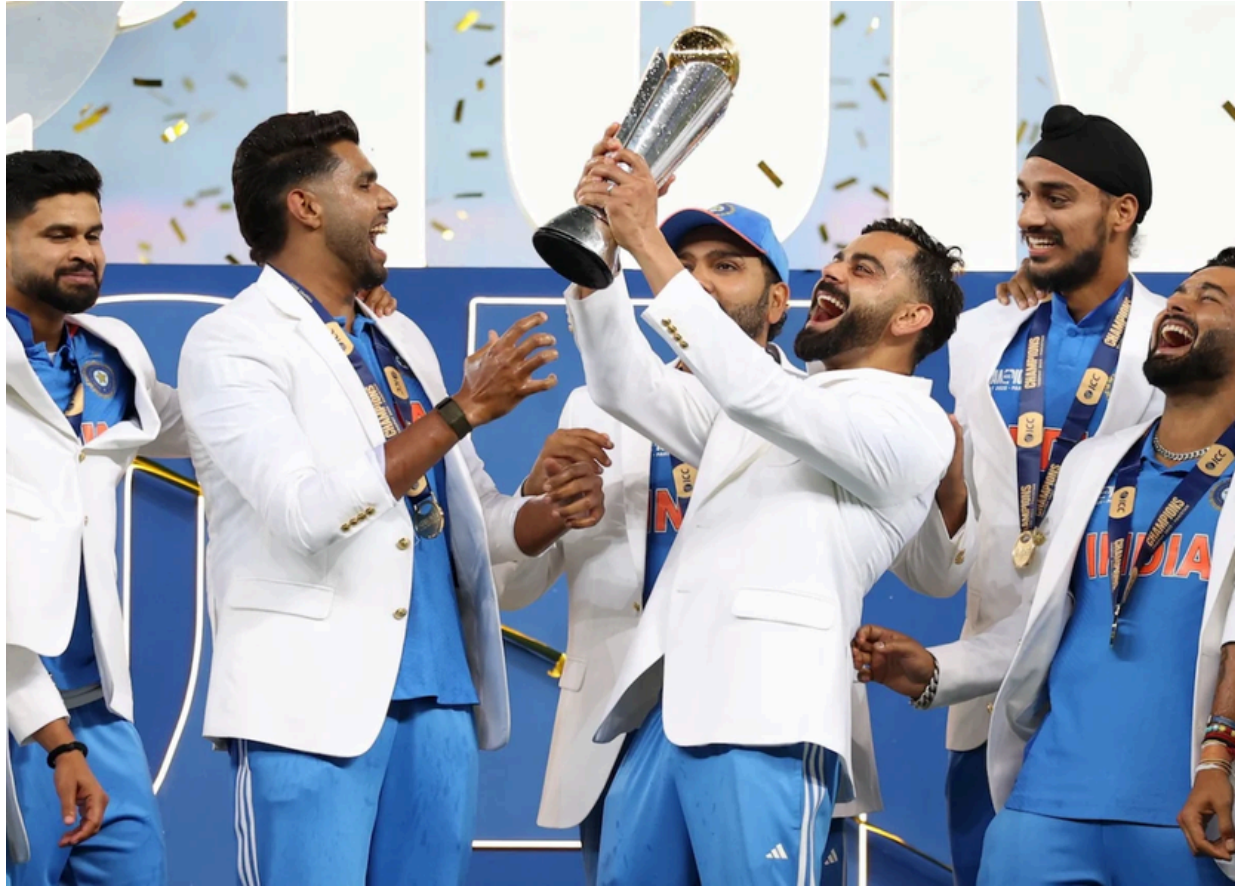
১২ বছৰীয়া প্ৰতীক্ষাৰ অন্তত হাতত চেম্পিয়নছ ট্ৰফী লৈ উল্লাস কোহলি আৰু টিম ইণ্ডিয়ান

ই-সংবাদ ক্ৰীড়া সেৱা, নগাঁও, ১০ মাৰ্চঃ নগাঁও ক্ৰীড়া সংস্থাৰ উদ্যোগত নুৰুল আমিন ষ্টেডিয়ামত চলি থকা আন্তঃক্লাব ক্লাষ্টাৰ-৩ ক্ৰিকেট প্রতিযোগিতাৰ আজি ছুপাৰ লীগৰ গ্ৰুপ-এৰ খেলত পলাইট ক্লাবে নগাঁও ছুপাৰ ষ্টাইকাৰ্ছক ১০ ৰাণত আৰু গ্ৰুপ-বিৰ খেলত জে বি ক্লাবে সঞ্জীৱন সমাজক ৩৪ ৰাণত হেৰুৱাই সম্পূৰ্ণ পইন্ট অৰ্জন কৰিছে। ইয়াৰে, পুৱাবেলাৰ গ্ৰুপ-এৰ খেলখনত পলাইট ক্লাবে পোনতে বেট ধৰি ১৮ অভাৱত ছটা উইকেটৰ বিনিময়ত ১১০ ৰাণ সংগ্ৰহ কৰে। প্ৰত্যুত্তৰত নগাঁও ছুপাৰ ষ্টাইকাৰ্ছে ১৫.৩ অভাৱত ১০০ ৰাণ সংগ্ৰহ কৰোতেই সকলোকেইটা উইকেটৰ পতন ঘটে। ইপিনে, বিয়লিৰ গ্ৰুপ-বিৰ খেলখনত জে বি ক্লাবে পোনতে বেট ধৰি ১৮ অভাৱত সকলোকেইটা উইকেট হেৰুৱাই ১৩৫ ৰাণ সংগ্ৰহ কৰে। প্ৰত্যুত্তৰত সঞ্জীৱন সমাজে ১০১ ৰাণহে কৰিবলৈ সক্ষম হয়।