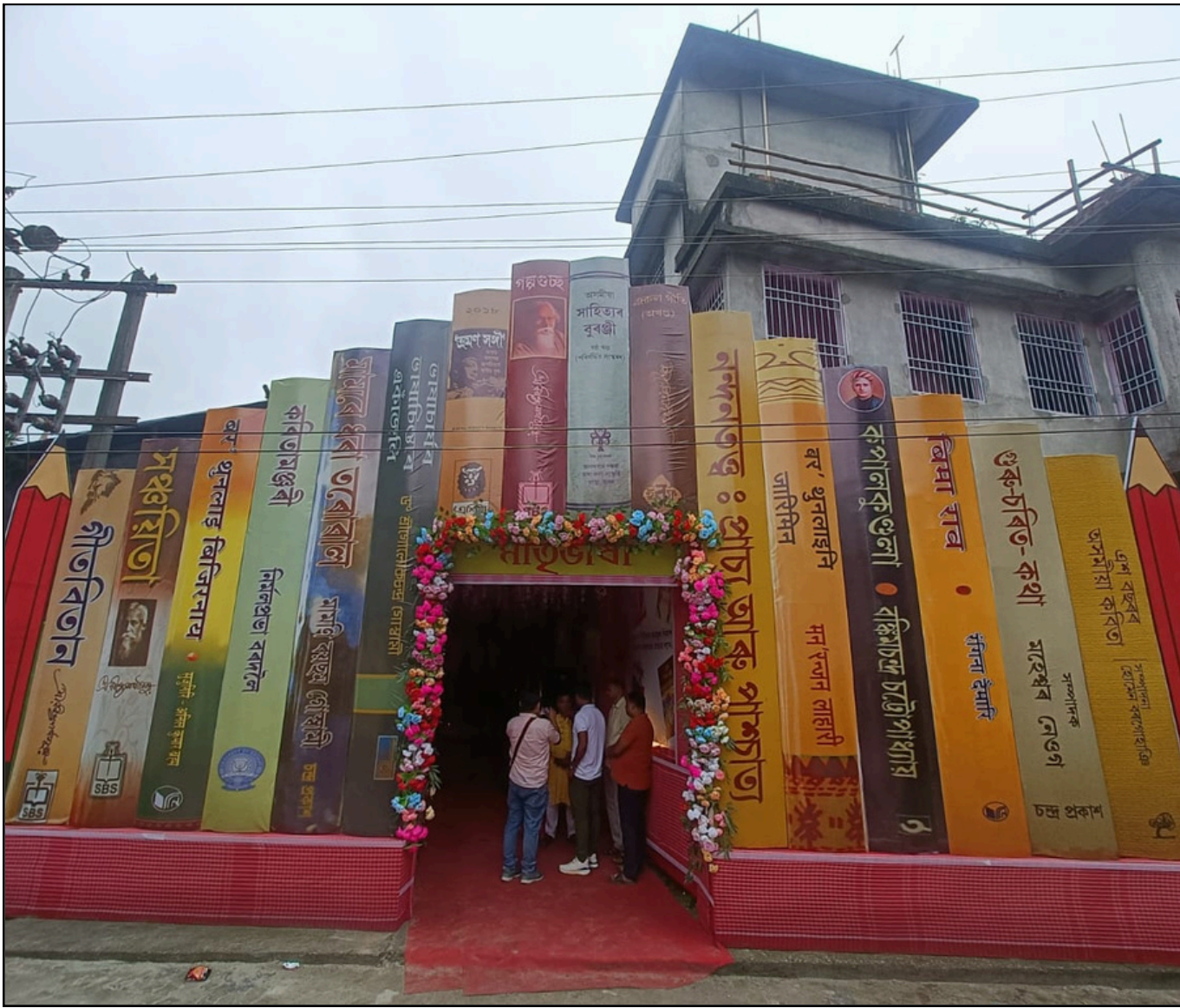
মাতৃভাষা থীমৰ ওপৰত নিৰ্মিত কোকৰাঝাৰৰ দুৰ্গা মণ্ডপ