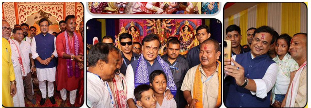
গুৱাহাটীৰ বিভিন্ন ঠাইত আয়োজিত পূজা উৎসৱস্থলীত মুখ্যমন্ত্ৰী