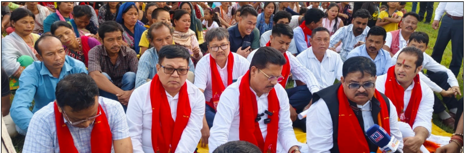
৯ হাজাৰ বিঘা ভূমি আদানিক গতাই দিব খোজা উমৰাংছুৰ ৯খন জনজাতীয় গাঁৱৰ লোকৰ সাক্ষাৎ কংগ্ৰেছৰ প্ৰতিনিধিৰ, বৃহস্পতিবাৰে