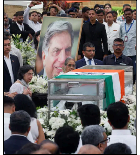
ৰতন টাটাৰ শেষ যাত্ৰা, মুম্বাইত বৃহস্পতিবাৰে