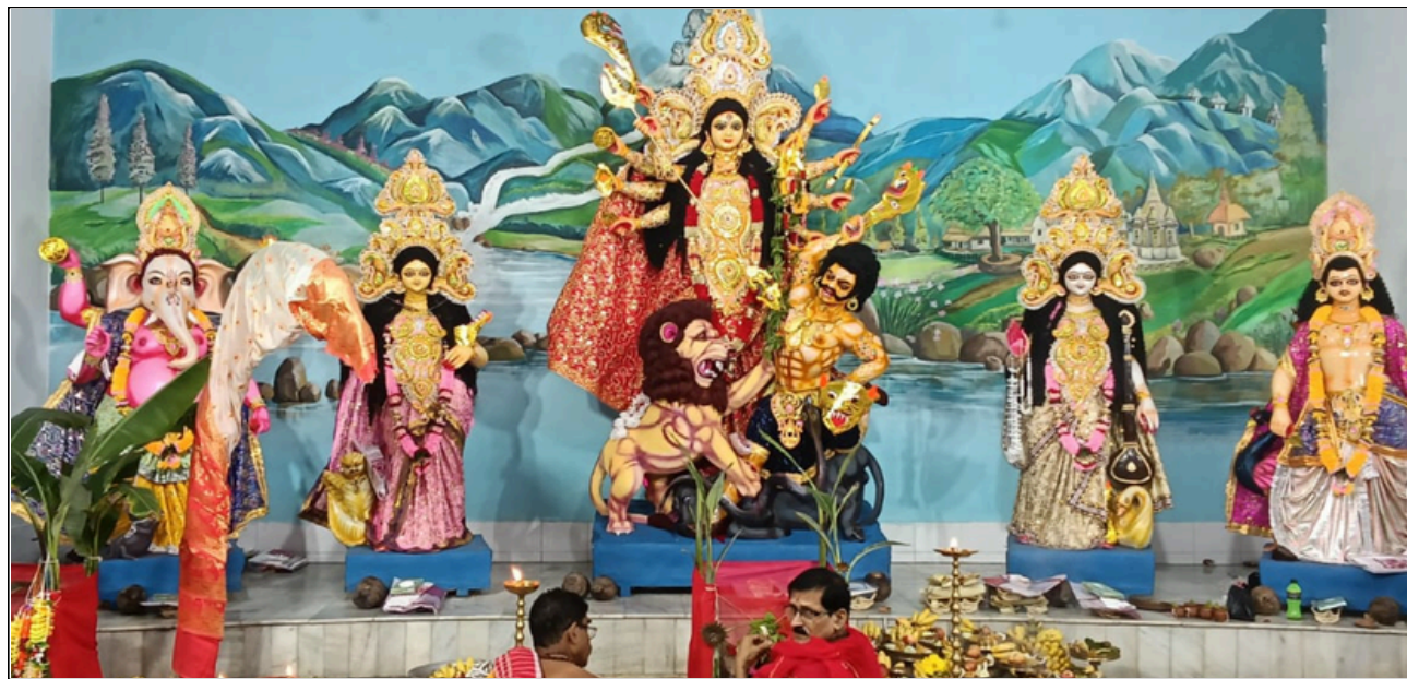
জাকজমকতাৰ বিপৰীতে ডুমডুমৰ ঐতিহ্যমণ্ডিত অসমীয়া পূজাত বিৰাজমান দুৰ্গা পূজাৰ আধ্যাত্মিক ৰূপ, ফটোঃ ৰাজীৱ

নাতিশীতোষ্ণ বতৰ ■ মণ্ডপে মণ্ডপে পাৰভঙা উছাহ ■ মন্ত্ৰোচ্চাৰণেৰে মুখৰ ৰাজ্য