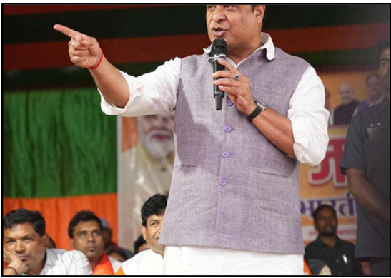
দিবনে ভোট বিজেপিক? ফটো ৰাৰখণ্ডৰ