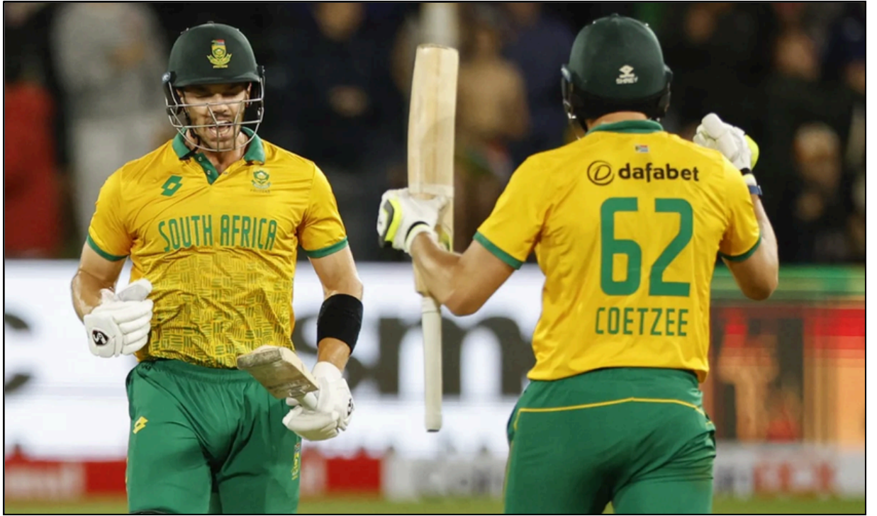
ভাৰতৰ বিৰুদ্ধে জয় লাভৰ পিছত দক্ষিণ আফ্ৰিকাৰ দুই বেটাৰৰ উল্লাস, দেওবাৰে

ই-সংবাদ, ৰঙিয়া, ১০ নৱেম্বৰঃ ৰঙিয়াৰ তুলসীবাৰী যুৱ সংঘৰ সৌজন্যত স্থানীয় আৰিমন্ত ষ্টেডিয়ামত অনুষ্ঠিত ১৮ বছৰ অনুৰ্ধৰ প্ৰাইজমাণি ফুটবল প্ৰতিযোগিতাৰ আজি অনুষ্ঠিত চূড়ান্ত খেলত ভয়ৰা এফচি দলে অসম একাদশ দলক ৩-০ গ'লৰ ব্যৱধানত পৰাস্ত কৰি চূড়ান্ত বিজয়ীৰ খিতাপ অৰ্জন কৰে। প্ৰতিযোগিতাৰ অন্তত বিজয়ী আৰু বিজিত দলক ট্ৰফী সহ নগদ ধন আগবঢ়োৱা হয়। প্ৰতিযোগিতাৰ প্ৰথম আৰু দ্বিতীয় পুৰস্কাৰ হিচাপে ৩৫০১ টকা আৰু ১৮০১ টকা আগবঢ়োৱা হয়।