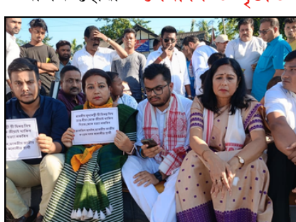
চামগুৰিত নিৰ্বাচনী হিংসা, নিৰাপত্তা বিচাৰি কংগ্ৰেছৰ প্ৰতিবাদ

ই-সংবাদ, ১০ নৱেম্বৰঃ বনকৰা যুৱতীৰ সহযোগত পিতৃয়ে নিজৰে ৫ বছৰীয়া কন্যাক অপহৰণৰ অভিযোগ উত্থাপন হোৱাত শেৰাংশ ৬ পৃষ্ঠাত