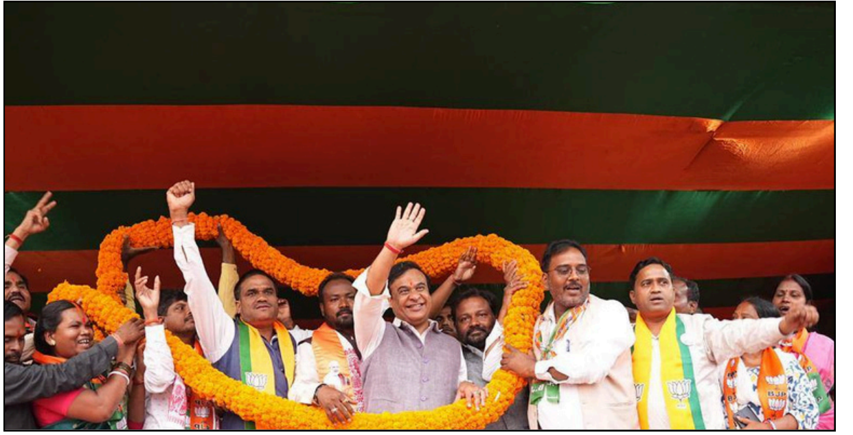
ৰাৰখণ্ডত অসম মুখ্যমন্ত্রী ড০ হিমন্ত বিশ্ব শৰ্মাক উল্ল আদৰণি, ফটো শনিবাৰৰ