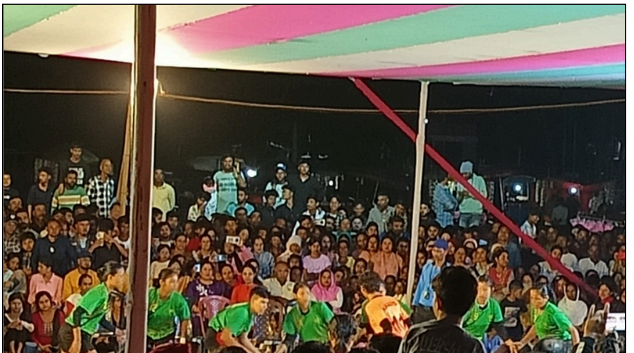
মৰিগাঁৱত চলি থকা সদৌ অসম আন্তঃজিলা মহিলা কাবাডী চাবলৈ দৰ্শকৰ ভিৰ, দেওবাৰে নিশা

সন্মানজনক ইনিংছত উপনীত হয়। দক্ষিণ আফ্ৰিকাৰ হৈ বলিং কৰা এজন বলাৰৰ বাদে ৬জন বলাৰে একোটাকৈ উইকেট হস্তগত কৰে। ইয়াৰ পিছত ১২৫ ৰানৰ বিজয় লক্ষ্য আগত লৈ ঘৰুৱা দলটোৰো সঘনে উইকেটৰ পতন ঘটাত ভাৰতে জয়ৰ আশা দেখিবলৈ লয় যদিও সেই আশা দীঘলীয়া হ'বলৈ নাপালে। ক্ৰিষ্টান ষ্টাবছে অপৰাজিত ৪৭ ৰান স্ক'ৰ কৰি উইকেটৰ এটা মুৰত স্থিৰে থাকি ১৯ অভাৱতে হাতত তিনিটা উইকেট অক্ষুন্ন ৰাখি ১২৮ ৰান সংগ্ৰহ কৰি দলক জয়ৰ সোৱাদ দিয়ে। ভাৰতৰ হৈ বাকী দুটা উইকেট লাভ কৰে ৰবি বিষ্ণয় আৰু অশ্বিনীপ সিঙে। খেলখনত প্লেয়াৰৰ অব দ্য মেচৰ সন্মান লাভ কৰে দলৰ জয়ত মুখ্য ভূমিকা পালন কৰা ষ্টাবছে। এই জয়েৰে ৪খন টি-২০ মেচৰ শৃংখলাটোত ১-১ৰ সমতা স্থাপন কৰিবলৈ সমৰ্থ হয় ঘৰুৱা দলটো। শৃংখলাৰ তৃতীয়খন মেচ ১৩ নৱেম্বৰত অনুষ্ঠিত হ'ব।