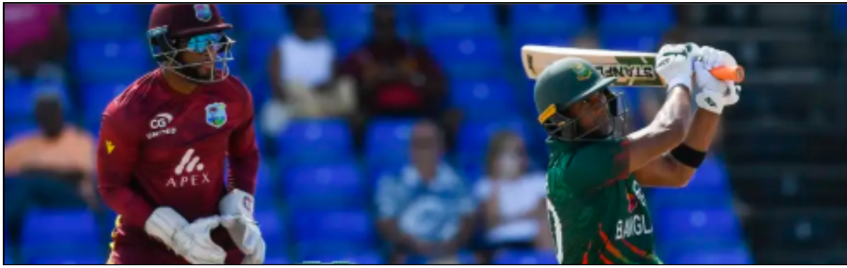
দ্বিতীয় এদিনীয়াত বাংলাদেশৰ বিৰুদ্ধে ৭ উইকেটত জয়ী বেট ইঞ্জি, মণ্ডলবাৰে