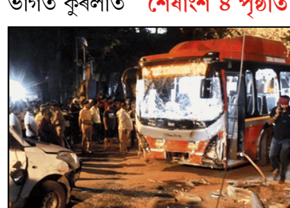
মুস্বাইৰ ৰাজপথত যমদূত সদৃশ হৈ পৰা তীব্ৰবেগী সেই বাছখন

মুস্বাই, ১০ ডিচেম্বৰঃ মুস্বাইত পুনৰ এবাৰ বেপৰোৱা গতিৰ বলি হ'ল নিৰীহ লোক! সোমবাৰে নিশাৰ ভাগত কুৰলাত শেৰাংশ ৪ পৃষ্ঠাত