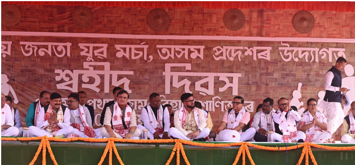
জামুগুৰিহাটৰ ঐতিহাসিক পকামুৰা পথাৰত আয়োজিত শ্বহীদ দিৱসত মুখ্যমন্ত্রী আৰু সতীৰ্থ বিধায়কসকল