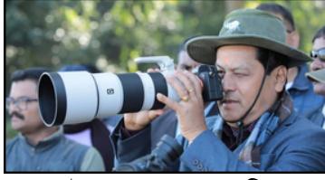
বহু দূৰলৈ চোৱাৰ প্ৰয়াস, কাজিৰঙাত

ভিডিঅ' ভাইৰেল! নিৰাসিত দুই কনিষ্টবল ই-সংবাদ বিশেষ, ১১ জানুৱাৰীঃ একাউণ্টাৰ কৰি বিখ্যাত হোৱা অসম আৰক্ষীৰ শেষাংশ ৫ পৃষ্ঠাত