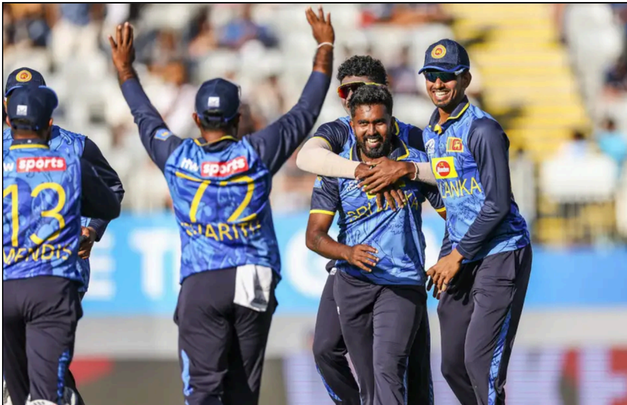
অকলেণ্ডত তৃতীয় এদিনীয়াত নিউজিলেণ্ডক ১৪০ ৰানত হৰুৱাই শ্ৰীলংকাৰ খেলুৱৈৰ বিজয়োল্লাস, শনিবাৰে

ই-সংবাদ, দুমুনিচকী, ১১ জানুৱাৰীঃ দৰং জিলাৰ অন্যতম সামাজিক অনুষ্ঠান দুমুনিচকীস্থিত 'পোহৰ' এন জি অ'ৰ উদ্যোগত দিবা-নৈশ প্ৰাইজমনি একক কেৰম খেল প্ৰতিযোগিতাৰ ব্যাপক প্ৰস্তুতি চলোৱা হৈছে। অহা ২৪, ২৫ আৰু ২৬ জানুৱাৰীত দুমুনিচকী চকতে অনুষ্ঠিত হ'ব লগা প্ৰতিযোগিতাৰ প্ৰথম পুৰস্কাৰ ১৫০০১ টকাৰ লগতে ট্ৰফী। দ্বিতীয় পুৰস্কাৰ ৮০০১ টকাৰ লগতে লগতে ট্ৰফী। আনহাতে, শ্ৰেষ্ঠ খেলুৱৈক নগদ ধনৰ লগতে ট্ৰফী প্ৰদান কৰা হ'ব। প্ৰতিযোগিতাত যোগদান কৰিব বিচৰাসকলক ৬৯০১৯৯৬০৫৩, ৯৮৬৪৮৬৬৭১৫ নম্বৰত যোগাযোগ কৰিবলৈ উদ্যোগসকলে আহ্বান জনাইছে।