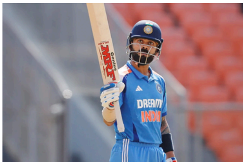
আহমেদাবাদৰ ক্ৰিজত ইংলেণ্ডৰ বিৰুদ্ধে কোহলিৰ বেটেৰে নিগৰিল অৰ্ধশতক