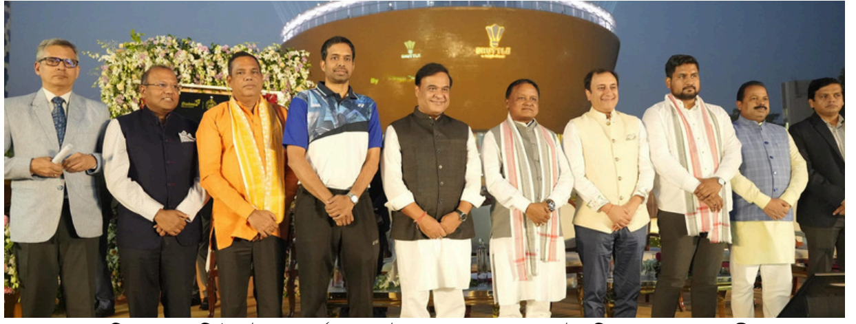
ওড়িশাত বেডমিণ্টন উচ্চ প্ৰদৰ্শন কেন্দ্ৰ উদ্বোধন কৰাৰ সময়ত উপস্থিত অসমৰ মুখ্যমন্ত্ৰী