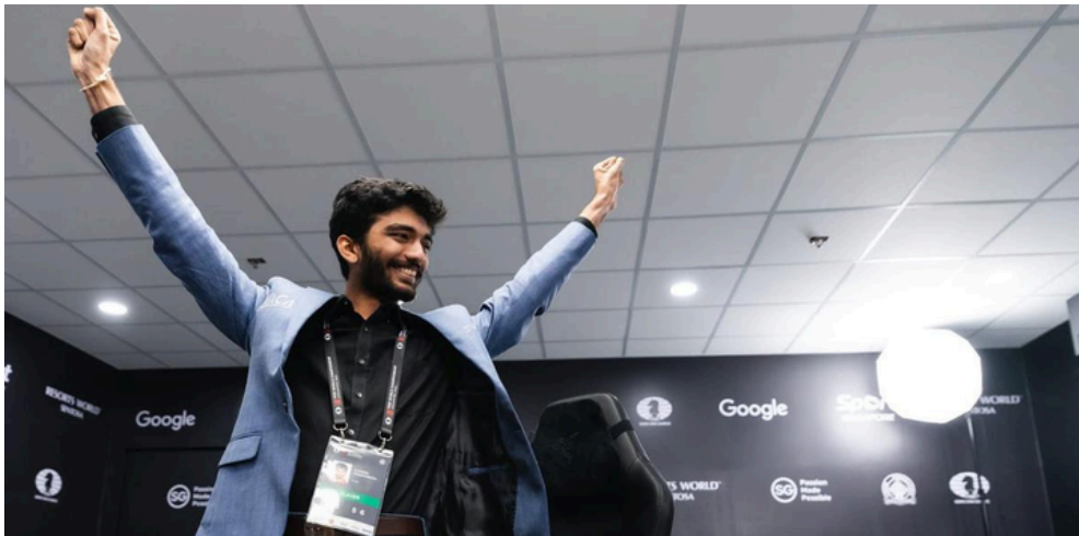
বাস্তৱ হ'ল শৈশৱৰ সপোন... ১৮ বছৰ বয়সতে বিশ্ব চেম্পিয়ন খিতাপ জয় কৰি উল্লাস গোকেশৰ, ছিংগাপুৰত

অভিলেখ ৰচি বিশ্ব দৰাত খিতাপ জয় ভাৰতৰ তাৰকা গোকেশৰ ছিংগাপুৰ, ১২ ডিচেম্বৰঃ দৰাখেলত এক নতুন ইতিহাস সৃষ্টি কৰিবলৈ সক্ষম হ'ল ভাৰতীয় দৰা তাৰকা দোন্মাৰাজু গোকেশ। মাত্ৰ ১৮ বছৰ বয়সতে দৰাখেলত শেৰাংশ ২ পৃষ্ঠাত