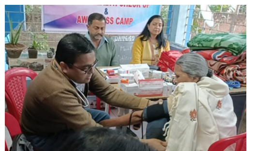
মথুৰাপুৰত বৃদ্ধাশ্ৰমত স্বাস্থ্য পৰীক্ষা শিবিৰ