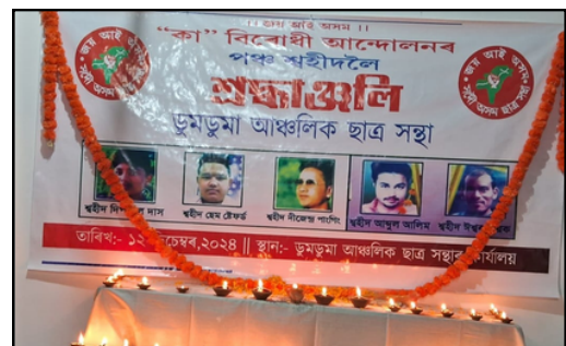
ডুমডুমাত কা-বিৰোধী পঞ্চ শহীদক শ্ৰদ্ধাঞ্জলি ডুমডুমা আঞ্চলিক ছাত্ৰ সন্থাৰ