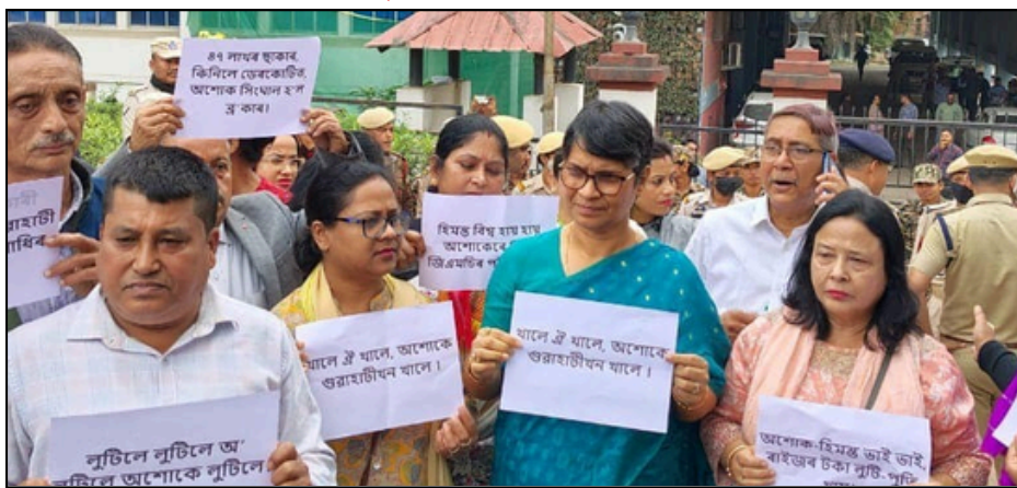
খালে ঐ খালে, অশোকে গুৱাহাটীখন খালে, মন্ত্ৰী সিংঘালৰ বিৰুদ্ধে কংগ্ৰেছৰ প্ৰতিবাদ

৪৭ লাখৰ ছুপাৰ ছাকাৰ ১ কোটি ২৮ লাখত ক্ৰয়