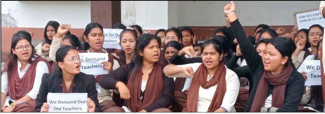
৬৪ শিক্ষকৰ বৰ্খাস্ত প্ৰত্যাহাৰৰ দাবীত ধৰ্ণাত বহিল বাক্সা পলিটেকনিকৰ ছাত্ৰ-ছাত্ৰী, ফটোঃ ই-সংবাদ, মুছলপুৰ