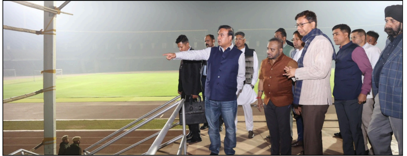
২৪ ফেব্ৰুৱাৰীত ৭,৫০০ শিল্পীয়ে বুম্বুৰ নৃত্য প্ৰদৰ্শন কৰিবলগীয়া সৰুসজাই ষ্টেডিয়ামৰ প্ৰস্তুতিৰ বুজ লৈছে মুখ্যমন্ত্ৰীয়ে