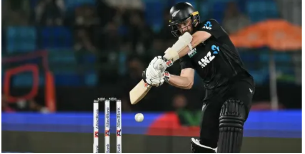
কৰাচীত অনুষ্ঠিত হৈ থকা ত্ৰিদেশীয় শৃংখলাত পাকিস্তানৰ বিৰুদ্ধে ষ্টেপ আউট হিট নিউজিলেণ্ডৰ কেন উইলিয়ামছনৰ