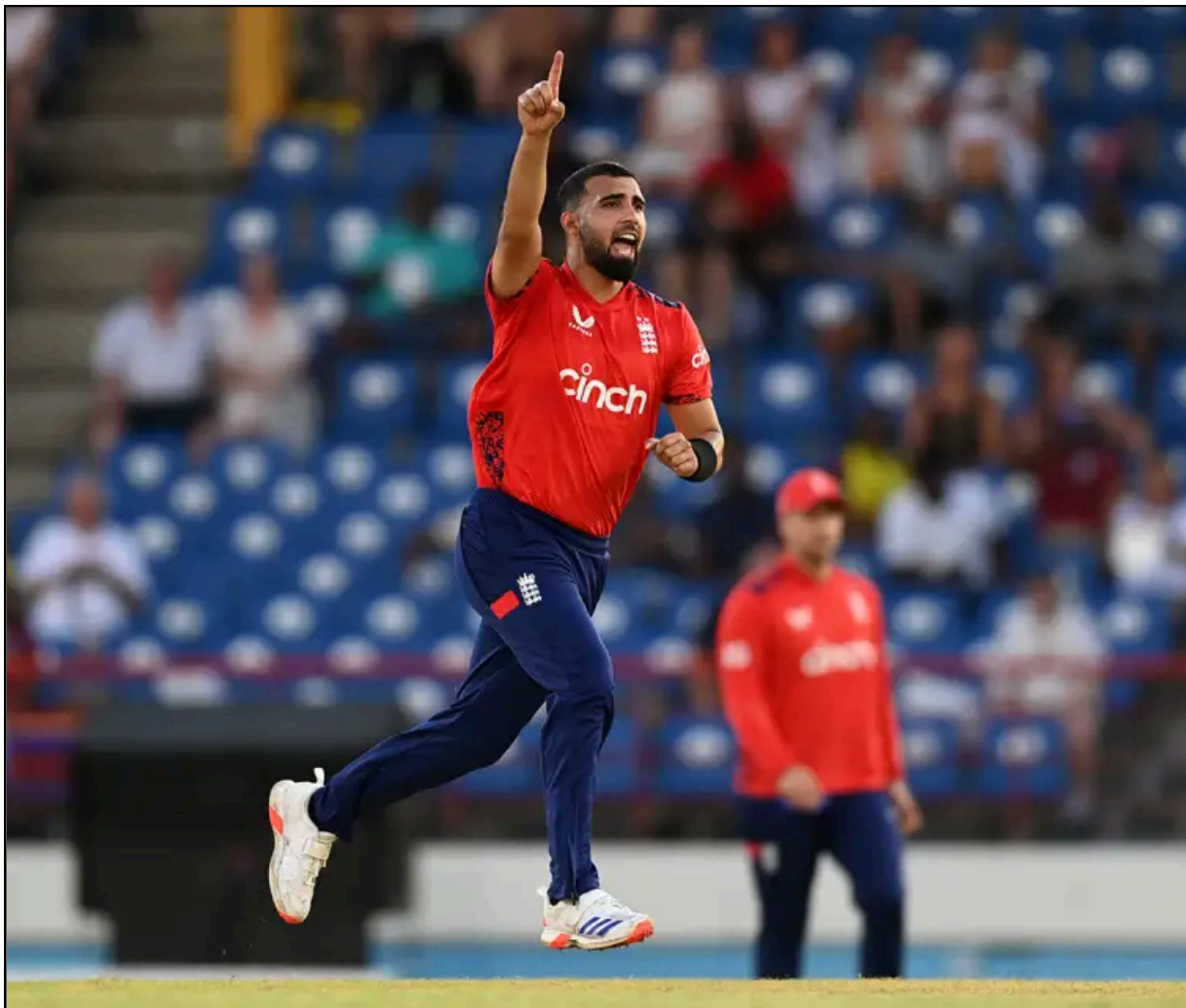
ৰেষ্ট ইণ্ডিজৰ বিৰুদ্ধে তৃতীয় টি-২০ত উইকেট দখলৰ পিছত ইংলেণ্ডৰ বলাৰৰ উল্লাস, বৃহস্পতিবাৰে