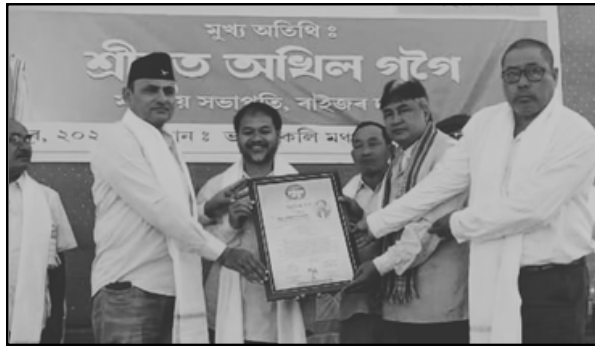
শদিয়াত ৰাইজৰ দলৰ জনসভাৰ এটি দৃশ্য, বৃহস্পতিবাৰে