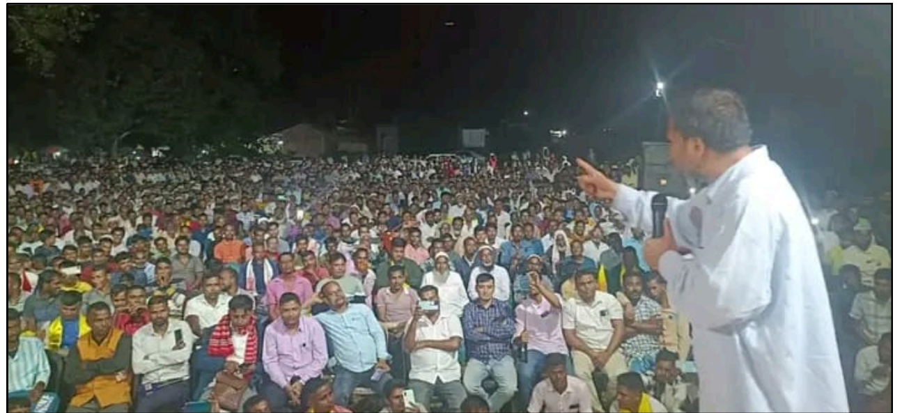
লখিমপুৰ জিলাৰ নাওবৈচা সমষ্টিৰ সোণাপুৰত ৰাইজৰ দলৰ বিশাল গণ সমাৰেশ