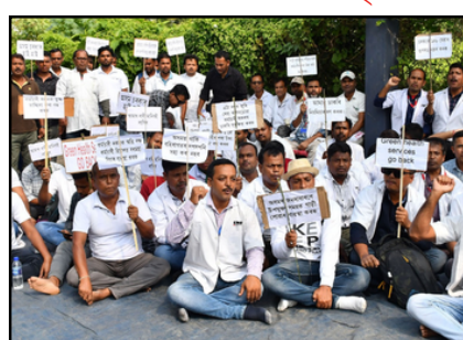
মহানগৰীৰ চহলত সদৌ অসম ১০৮ কৰ্মচাৰী সম্ভাৰ প্ৰতিবাদ

ই-সংবাদ, ১৪ নৱেম্বৰঃ শীঘ্ৰে প্ৰাপ্য আদায় দিয়াৰ দাবীৰে পুনৰ আন্দোলন তীব্ৰতৰ কৰিছে সদৌ অসম ১০৮ শেষাংশ ৫ পৃষ্ঠাত