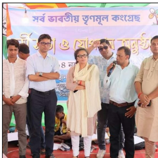
হাজোত তৃণমূল কংগ্ৰেছৰ কাৰ্যালয় উদ্বোধনী অনুষ্ঠানত সাংসদ সুস্মিতা দেৱ