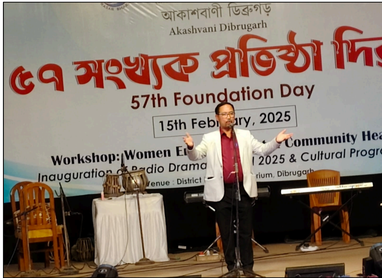
আকাশবাণী ডিব্ৰুগড় কেন্দ্ৰৰ ৫৭ সংখ্যক প্ৰতিষ্ঠা দিৱস উদযাপন