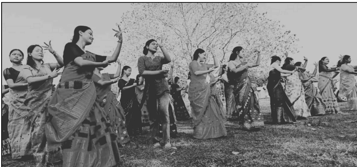
বঢ়মপুৰত এনেদৰে চলিছে ৰাসৰ প্ৰস্তুতি