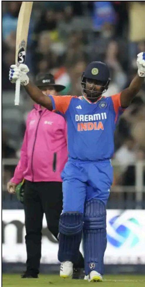
দক্ষিণ আফ্ৰিকাৰ বিৰুদ্ধে চতুৰ্থ টি-২০ত সঞ্জু ছেমছনৰ বিস্ফোৰক শতক