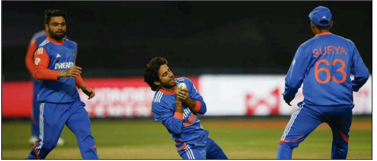
চতুৰ্থ টি-২০ত জয়ী ভাৰত, দক্ষিণ আফ্ৰিকাৰ বিৰুদ্ধে চাৰিখন মেচৰ টি-২০ শৃংখলা দখল

ভাগ ল'ব ৩-৪ সহস্ৰাধিক এথলীটে, ১৫ লাখৰ পুৰস্কাৰ