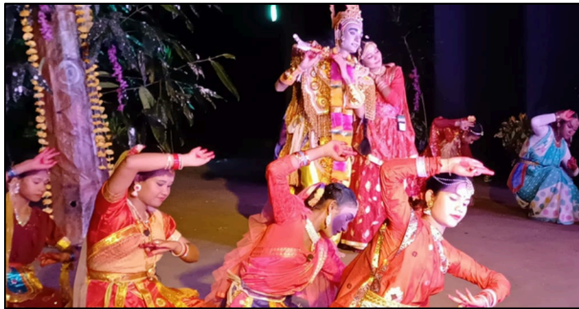
মাজুলীৰ ৰাসৰ মধুৰ মুহূৰ্ত

ই-সংবাদ, ১৫ নৱেম্বৰঃ আজিৰে পৰা আৰম্ভ হৈছে নামনি অসমৰ ঐতিহাসিক নলবাৰীৰ হৰি মন্দিৰৰ ৰাস মহোৎসৱ। বিগত প্ৰায় কেইবা সপ্তাহ ধৰি প্ৰস্তুতিৰ অন্তত শেষাংশ ৩ পৃষ্ঠাত