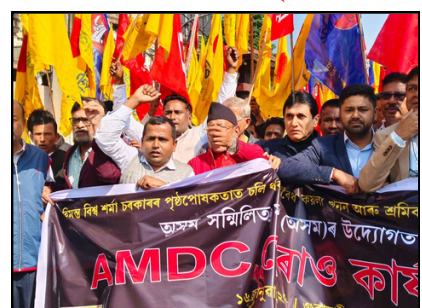
খনিজ উন্নয়ন নিগমৰ কাৰ্যালয় ঘেৰাও বিৰোধীৰ, বাতৰি ভিতৰৰ পৃষ্ঠাত

ই-সংবাদ, চাবুৱা-লাহোৱাল, ১৬ জানুৱাৰীঃ ২২ বছৰীয়া আদিবাসী যুৱতীৰ হত্যাকাণ্ডই জোকৰি শেয়াংশ ৬ পৃষ্ঠাত