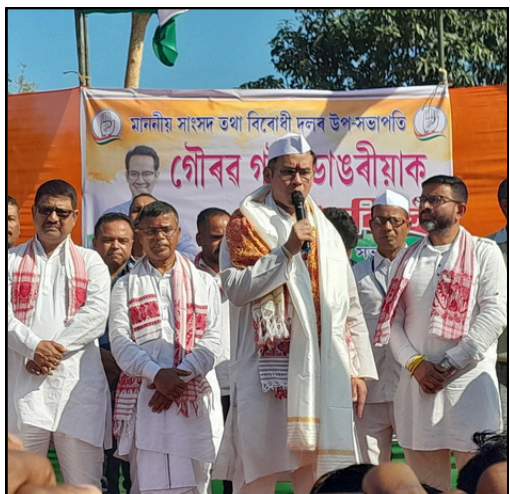
নলবাৰীত গৌৰৱ গগৈয়ে সম্বোধন কৰা এখন ৰাজহুৱা সভাৰ দৃশ্য