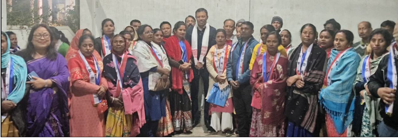
ডিকমত দুই শতাধিকে যোগ দিলে অগপত, ফটোঃ ই-সংবাদ, চাবুৰা-লাহোৱাল