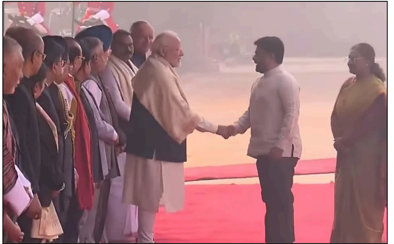
শ্ৰীলংকাৰ ৰাষ্ট্ৰপতি অনুৰা কুমাৰা দিচানায়েকক আদৰণি ৰাষ্ট্ৰপতি দ্ৰৌপদী মুৰ্মু আৰু প্ৰধানমন্ত্ৰী নৰেন্দ্ৰ মোদীৰ

কৰিছে। সম্প্ৰতি সেনাই শিবিৰ সম্প্ৰসাৰণ কৰা বিদ্যালয়ৰ মাটিত এটা টাৱাৰ নিৰ্মাণৰ কাম আৰম্ভ কৰিছে। এই নিৰ্মাণ কাৰ্যই মহাবিদ্যালয়খনৰ প্ৰায় দুবিঘা মাটি অধিগ্ৰহণ কৰিব। ইয়াকে লৈ এতিয়া শংকিত হৈ পৰিছে বিদ্যালয় কৰ্তৃপক্ষৰ লগতে স্থানীয় ৰাইজ। কিয়নো বিদ্যালয়খনত নতুনকৈ বাণিজ্য শাখা অন্তৰ্ভুক্ত কৰাৰ উপৰি বিজ্ঞান শাখাৰ বাবেও আবেদন জনোৱা হৈছে। এনে ক্ষেত্ৰত শ্ৰেণী কোঠা সম্প্ৰসাৰণৰ দিশটোত ভূমি অধিগ্ৰহণ কৰি ৰাখিলে অসুবিধাৰ সৃষ্টি হ'ব। কিন্তু এই স্পৰ্শকাতৰ বিষয়টো জিলা প্ৰশাসনক অৱগত কৰাৰ পাছতো বৰ্তমানলৈকে কোনো যথোচিত ব্যৱস্থা গ্ৰহণ নকৰাটোত উদ্বেগ প্ৰকাশ কৰিছে মহাবিদ্যালয় কৰ্তৃপক্ষই। এতিয়া জিলা প্ৰশাসনে বিষয়টো কিদৰে গ্ৰহণ কৰে সেয়া পৰৱৰ্তী সময়তহে লক্ষণীয় হ'ব।