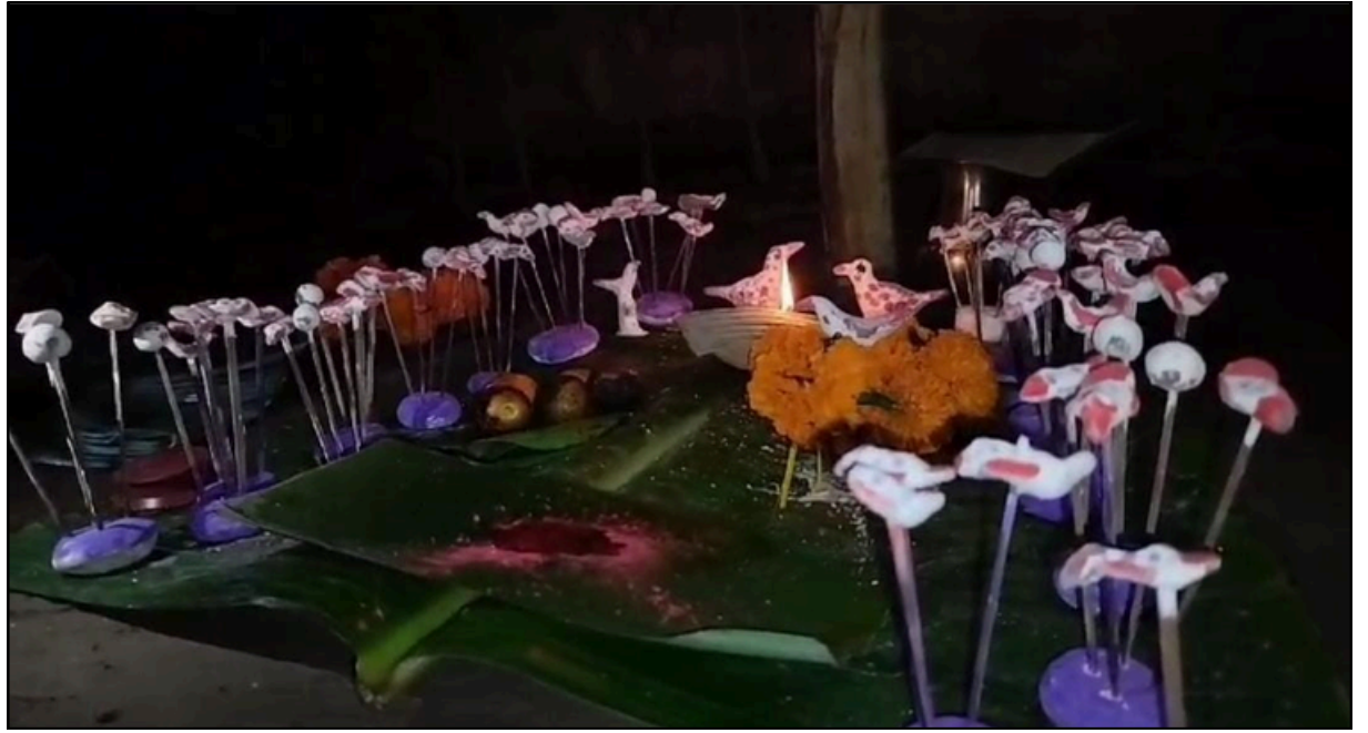
তীৰ্থনগৰী হাজোত উখল-মাখল পৰিবেশ, চৰাই পূজাৰ এটি বিশেষ মুহূৰ্ত