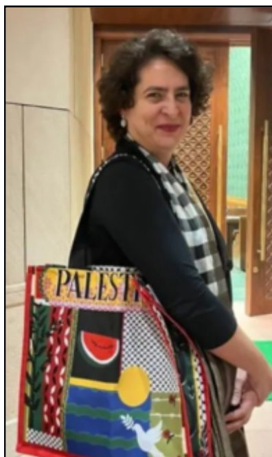
সংসদৰ বাহিৰত বিশেষ বেগ, সংসদৰ ভিতৰত বাংলাদেশৰ হিন্দুৰ প্ৰসংগ

নতুন দিল্লী, ১৬ ডিচেম্বৰঃ মন গ'লেই নিজৰ ইচ্ছা অনুসৰি সিদ্ধান্ত ল'ব নোৱাৰা অৱস্থা প্ৰধানমন্ত্রী নৰেন্দ্ৰ মোদীৰ। জেডিইউ, টিডিপিৰ কান্ধত ভেঁজা দি থিয় ৮ পৃষ্ঠাত চাওক