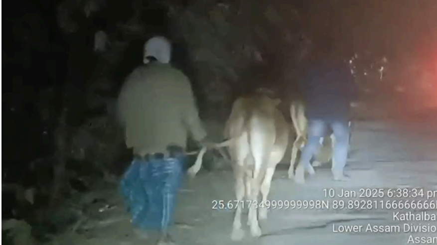
এনেদৰে নামনি অসমৰ উন্মুক্ত সীমান্তৰে বাংলাদেশলৈ চলিছে গো-ধনৰ সৰবৰাহ।

নিউয়ৰ্ক, ১৭ জানুৱাৰীঃ পুনৰ মধ্য আকাশত বিপৰ্যয়ৰ সন্মুখীন হ'ল স্পেচএক্সৰ অত্যাধুনিক ২ পৃষ্ঠাত চাওক