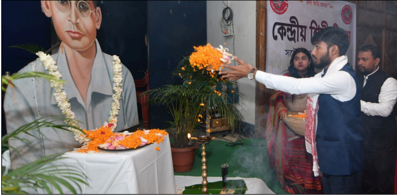
উজান বজাৰত গুৱাহাটী ছাত্ৰ সন্থাৰ শিল্পী দিৱস উদযাপন, শুকুৰবাৰে

বিশেষ ভূমিকা বহন কৰিব বুলি উল্লেখ কৰি এই পদক্ষেপৰ শলাগ লয়। এই বাটৰ নাটসমূহৰ জৰিয়তে জিলাখনৰ বিভিন্ন নাট্যগোষ্ঠীৰ কলা-কৌশলীয়ে ভূমিকম্প, জুই, ধুমুহা, বজ্ৰপাত, বিজুলী-ঢেৰেকনি, বানপানী আদি প্ৰাকৃতিক দুৰ্যোগক মূল বিষয়বস্তু হিচাপে লৈ ৰাইজলৈ সজাগতামূলক বাৰ্তা প্ৰেৰণ কৰিব। শুভাৰম্ভণি অনুষ্ঠানত যোৰহাট পৌৰসভাৰ উপ-পৌৰপতি, জিলা পৰিষদৰ মুখ্য কাৰ্যবাহী বিষয়া, অতিৰিক্ত জিলা আয়ুক্ত তথা জিলা দুৰ্যোগ ব্যৱস্থাপনা প্ৰাধিকৰণৰ মুখ্য কাৰ্যবাহী বিষয়া, ৰাজহ চক্ৰ বিষয়া, অসম ৰাজ্যিক দুৰ্যোগ ব্যৱস্থাপনা প্ৰাধিকৰণৰ বিষয়া প্ৰমুখ্যে জিলা দুৰ্যোগ ব্যৱস্থাপনা প্ৰাধিকৰণৰ বিষয়া-কৰ্মচাৰীসকল উপস্থিত থাকে। আনহাতে, পশ্চিম যোৰহাট ৰাজহ চক্ৰৰ অন্তৰ্গত মালৌ আলি উচ্চতৰ মাধ্যমিক বিদ্যালয়ৰ চৌহদটো বাটৰ নাট কাৰ্যসূচীৰ শুভাৰম্ভণি কৰা হয়। উল্লেখ্য যে এই বাটৰ নাট কাৰ্যসূচী জিলাখনৰ আটাইকেইটা ৰাজহ চক্ৰৰ বিভিন্ন এলেকা সামৰি অব্যাহত থাকিব।