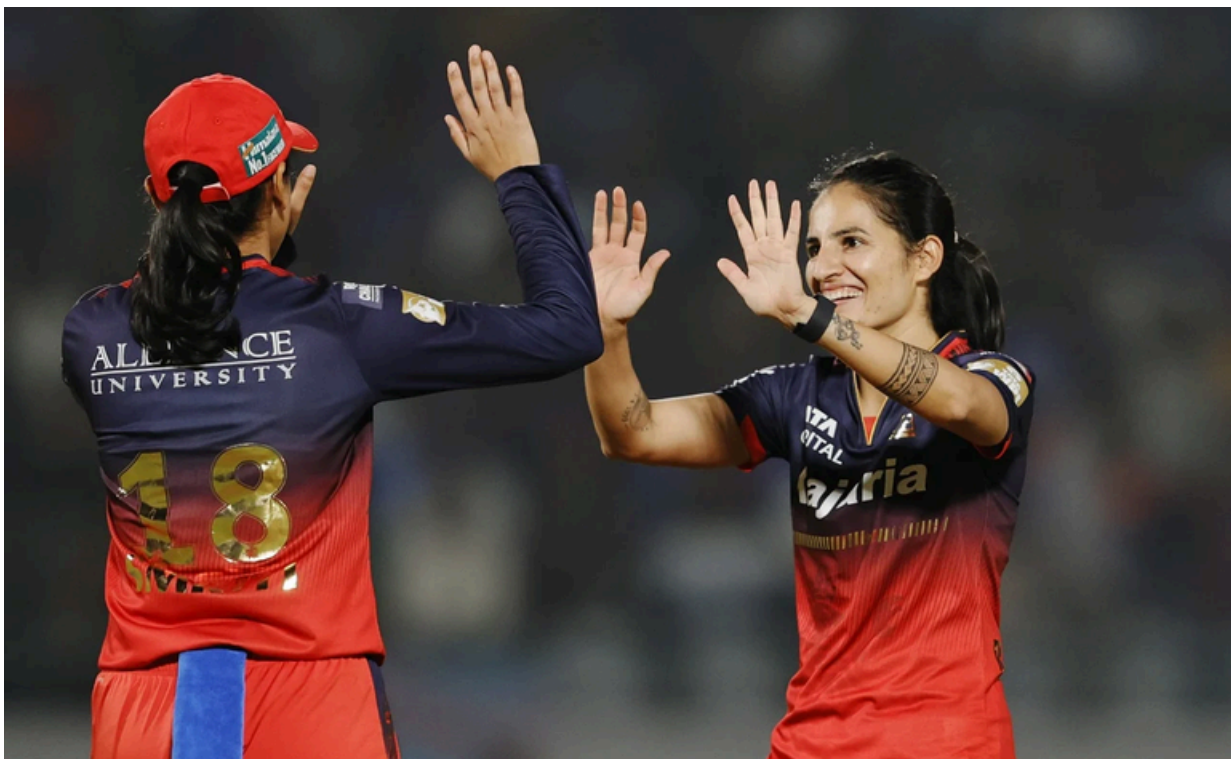
বদদোৰাত ডব্লিউপিএলত দিল্লী কেপিটেলছৰ বিৰুদ্ধে উইকেট দখলৰ পিছত উল্লাস আৰুচিবিৰ ৰেণুকা সিঙৰ