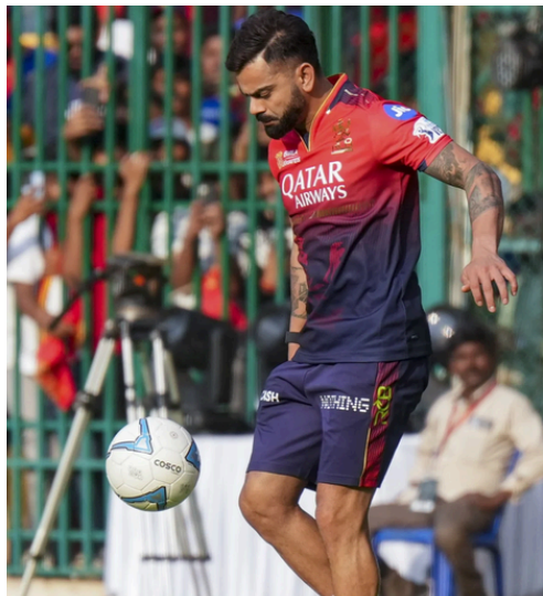
আইপিএলৰ পূৰ্বে এনেদৰে অনুশীলনত ব্যস্ত আৰুচিবিৰ বিৰাট কোহলিৰ

মুম্বাই, ১৭ মাৰ্চঃ আইপিএল আৰম্ভ হ'বলৈ আৰু মাত্ৰ মাজত পাঁচটা দিন। ইতিমধ্যে ক্ৰিকেটৰ মহাৰণক লৈ সমগ্ৰ দেশত বিয়পি পৰিছে উত্তেজনা, প্ৰস্তুতি সম্পূৰ্ণ কৰি তুলিছে ফ্ৰেঞ্চাইজী সমূহেও। ইতিমধ্যে স্থানীয় আৰু বিদেশী তাৰকাসকলে তেওঁলোকৰ দলত যোগদান কৰিছে। কোনটো দল ভাল, কোন আগবাঢ়ি আছে, এই ছিজনৰ কি আচৰিত হ'ব পাৰে সেই সন্দৰ্ভত অনুৰাগীৰ মাজত জল্পনা-কল্পনাৰ সৃষ্টি হৈছে। অৱশ্যে আইপিএল আৰম্ভ হোৱাৰ পূৰ্বে অনুৰাগীৰ বাবে এটা বেয়া খবৰ। এইবাৰ আৰু বিনামূলীয়াকৈ উপলব্ধ নহ'ব আইপিএলৰ মেচ। দুবছৰৰ অন্তত ভাৰতত বিনামূলীয়া লাইভ স্ট্ৰীমিং বন্ধ কৰি দিলে বিলায়েন্স জিঅ'ই। দৰ্শকে ২০২৩ চনৰ পৰা জিঅ' চিনেমা এপত বিনামূলীয়াকৈ আইপিএল চোৱাৰ সুযোগ লাভ কৰি আহিছিল। যোৱা ছিজনত জিঅ'চিনেমাৰ জৰিয়তে প্ৰায় ৬২ কোটি লোকে এই প্ৰতিযোগিতা উপভোগ কৰিছিল। কিন্তু এইবাৰ বিলায়েন্স জিঅ' কৰ্তৃপক্ষই সেই সেৱা বন্ধ কৰি দিছে। এতিয়াৰ পৰা যদি আইপিএল চাব বিচাৰে তেন্তে টকা খৰচ কৰিব লাগিব। কেইমাহমানৰ আগতে বিলায়েন্স জিঅ'ই ডিজনী হটস্পটৰ সৈতে বান্ধ খাইছিল, যাৰ ফলত দুয়োটা প্লেটফৰ্ম একত্ৰিত হৈ 'জিঅ'হটস্পট' গঠন কৰা হৈছিল। নতুন মঞ্চত সম্প্ৰচাৰ হ'ব আইপিএল। অৱশ্যে ইয়াৰ বাবে আপুনি চাবলৈ কৰিব লাগিব। জানিব পৰা মতে, বিলায়েন্স জিঅ'ই আইপিএলৰ বাবে বিশেষ বিচাৰ্জ প্লেণ আনিবলৈ ওলাইছে। অৱশ্যে বিনামূলীয়াকৈ আইপিএল চোৱাৰ সুযোগ হেৰুৱাই নিৰাশ হৈ পৰে অধিকাংশ ক্ৰিকেট অনুৰাগী।