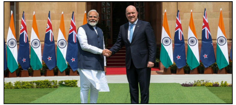
নতুন দিল্লীত নিউডিলেঙৰ প্ৰধানমন্ত্ৰী ক্ৰিষ্টফাৰ লাক্সনক আদৰণি প্ৰধানমন্ত্ৰীৰ

ই-সংবাদ, ১৭ মাৰ্চঃ অসম প্ৰদেশ কংগ্ৰেছে পঞ্চায়ত নিৰ্বাচনৰ তাৰিখ ৩০ মাৰ্চৰ ভিতৰত ঘোষণা নকৰিলে গৌহাটী উচ্চ ন্যায়ালয়ৰ কাষ চাপিব বুলি ভাবুকি দি হিমন্ত বিশ্ব শৰ্মা নেতৃত্বাধীন ৰাজ্য চৰকাৰক কঠোৰ সতৰ্কবাণী প্ৰদান কৰিছে। দলৰ সভাপতি ভূপেন কুমাৰ বৰাই বিলম্ব হোৱাৰ ফলত কেন্দ্ৰীয় থামোন্নয়ন পুঁজিত ১১০০ কোটি শেষাংশ ৪ পৃষ্ঠাত