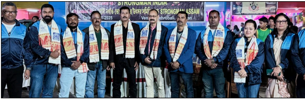
নগাঁৱত ষ্ট্ৰংমেন অসমৰ ৰাজ্যিক সমিতিৰ একাংশ বিষয়ববীয়া, শনিবাৰে