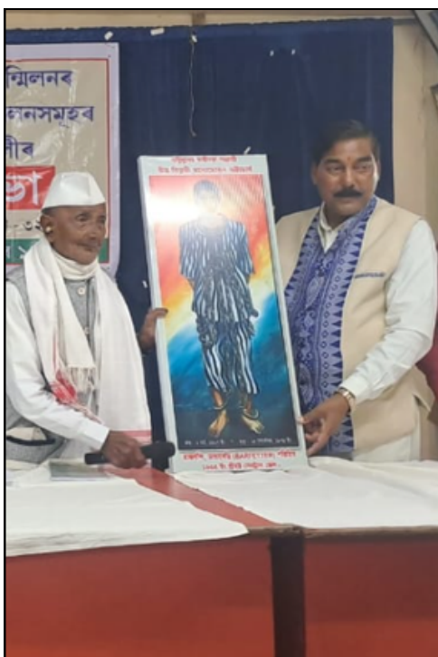
গুৱাহাটীৰ ৰূপনগৰত মুক্তিযুঁজাৰু সন্মিলনৰ সম্পাদক মণ্ডলীৰ সভাৰ এটি দৃশ্য

প্ৰতিবাদ জনায়। সংগঠনটোৱে ক'লা বেজ পৰিধান কৰি প্ৰতিবাদ সাব্যস্ত কৰাৰ লগতে এক সমূহীয়া প্ৰাৰ্থনা অনুষ্ঠানৰ আয়োজন কৰে। উল্লেখ্য যে নেলীৰ গণহত্যাৰ ৪২ বছৰৰ পাছতো আজিলৈকে ভুক্তভোগীয়ে ন্যায় নোপোৱাত আমছুৱে প্ৰতি বছৰ ১৮ ফেব্ৰুৱাৰী তাৰিখে বিভিন্ন স্থানত ক'লা বেজ পৰিধান কৰি ক'লা দিৱস পালনেৰে প্ৰতিবাদ কৰে।