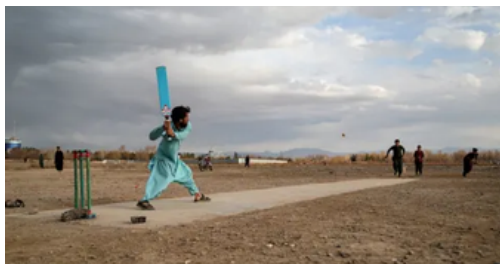
ক্ৰিকেটৰ বতৰত মৰুৰ দেশৰ আবেলি এনেদৰে ব্যস্ত হৈ পৰিল কেইজনমান আফগান যুৱক