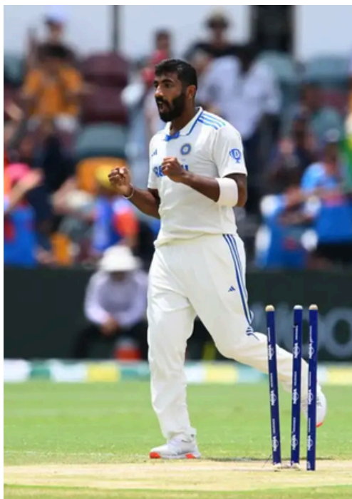
উইকেট দখল কৰি বুমৰাহৰ উল্লাস

ই-সংবাদ, মোৰাঝাৰ, ১৮ ডিচেম্বৰঃ হোজাই জিলা আয়ুক্তৰ নিৰ্দেশ মৰ্মে হোজাইৰ শ্ৰম পৰিদৰ্শকে মোৰাঝাৰ আৰক্ষীৰ সহযোগত, আজি মোৰাঝাৰ আৰু দেৱস্থান বজাৰত অভিযান চলায়। হোজাই জিলাৰ শ্ৰম পৰিদৰ্শক আৰু চাইল্ড লাইনে মোৰাঝাৰ আৰক্ষীৰ সহযোগত মোৰাঝাৰ আৰু দেৱস্থানৰ পৰা ছগৰাকী শিশু শ্ৰমিক উদ্ধাৰ কৰা ঘটনাই সমগ্ৰ জিলাখনত তীব্ৰ চাঞ্চল্যৰ সৃষ্টি কৰিছে। ইফালে উদ্ধাৰ কৰা শিশু শ্ৰমিকক চাইল্ড লাইনে লাইফ ফাউণ্ডেশ্যনত ৰখাৰ ব্যৱস্থা কৰিছে। শিশু শ্ৰমিক নিয়োগ কৰা এই লোকসকলৰ বিৰুদ্ধে কঠোৰ ব্যৱস্থা লোৱাৰ দাবী জনাইছে ৰাইজে।