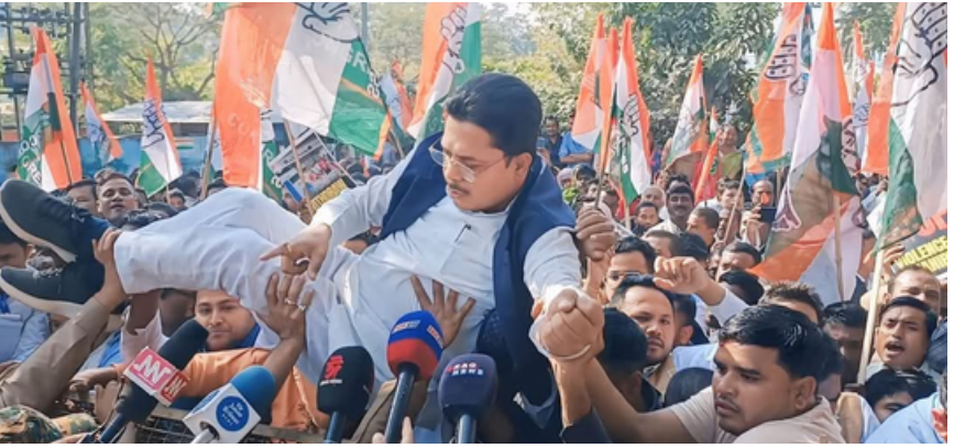
প্ৰদেশ কংগ্ৰেছৰ ৰাজভৱন চলো কাৰ্যসূচীৰ এটি দৃশ্য, বুধবাৰে গুৱাহাটীত

কংগ্ৰেছ, তৃণমূল কংগ্ৰেছকে ধৰি বহু বিৰোধী দলৰ সাংসদে আনকি শ্বাহৰ পদত্যাগৰো দাবী উত্থাপন কৰিছে। উল্লেখ্য যে, মঙলবাৰে শেৰাংশ ২ পৃষ্ঠাত