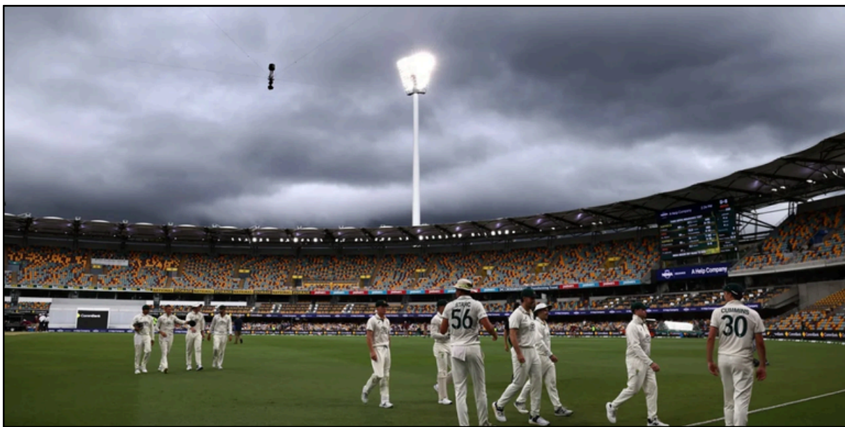
বৰ্ষাবিন্মিত ব্ৰীছবেন টেষ্ট অমীমাংসিতভাৱে সমাপ্ত, পইণ্ট ভগাই ল'লে দুয়ো দলে, ফটো বৃথবাৰৰ