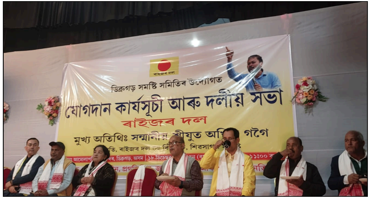
ডিব্ৰুগড়ত ৰাইজৰ দলৰ বৃহৎ যোগদান কাৰ্যসূচীৰ এটি দৃশ্য, বুধবাৰে