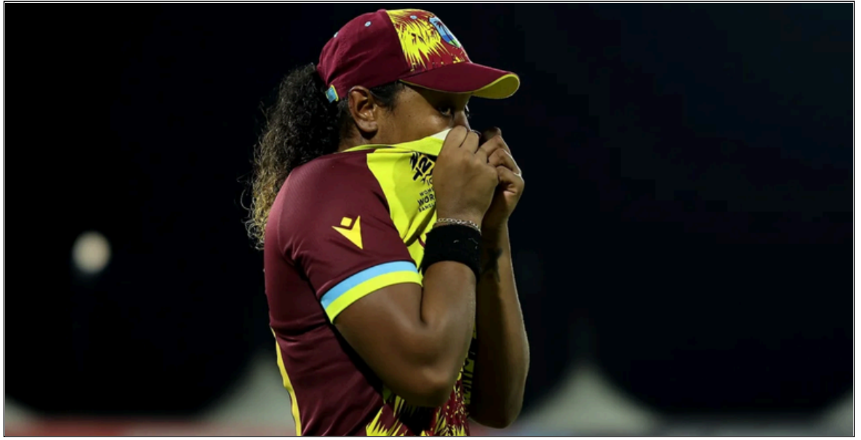
ব্যৰ্থতাৰ উচুপনি ঢাকিবলৈ প্ৰয়াস ৰেপ্ট ইণ্ডিজৰ হাইলি মেথিউজৰ, শ্বাৰজাহত শনিবাৰে