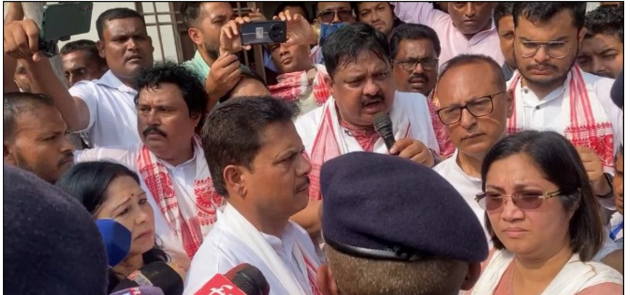
বিজেপিৰ বিৰুদ্ধে মাৰ বান্ধি যুজাৰ পণ! চামগুৰি কাণ্ডক লৈ অসম আৰক্ষীৰ নিৰ্লিপ্ততাৰ বিৰুদ্ধে কংগ্ৰেছে কঁপালে ৰূপহী

গোচৰৰ তদন্তৰ নিৰ্দেশ দিয়ে। ইয়াৰ পিছতে ন্যায়ালয়ৰ এই নিৰ্দেশক প্ৰত্যাহান জনায় উচ্চতম ন্যায়ালয়ৰ দাবস্থ হয় সদগুৰুক সংস্থা। উচ্চতম ন্যায়ালয়ত সদগুৰুক সংস্থাই দাখিল কৰা আবেদনত উল্লেখ কৰে যে মাদ্ৰাছ উচ্চ ন্যায়ালয়ৰ নিৰ্দেশৰ পিছতে শ শ আৰক্ষী তেওঁলোকৰ আশ্ৰমত প্ৰৱেশ কৰিছে, যাৰ ফলত আশ্ৰমৰ ভাৱমূৰ্তি বিনষ্ট হৈছে। আৰক্ষীৰ তদন্তই আশ্ৰমৰ ওপৰত আস্থা ৰক্ষাসকলৰ ধৰ্মীয় অনুভূতিতো আঘাত হনা বুলি দাবী কৰে সংস্থাটোৱে। ইফালে উচ্চতম ন্যায়ালয়ত এই গোচৰৰ শুনানিৰ সময়ত 'ব্ৰেইনৱাছ' কৰা বুলি অভিযোগ অনা অধ্যাপকগৰাকীৰ দুই কন্যাৰ ভাষ্যও ভাৰ্চুৱেলী গ্ৰহণ কৰা হয়। শুনানিৰ সময়ত ৩৯ আৰু ৪২ বৰ্ষীয় মহিলা দুগৰাকীয়ে তেওঁলোকৰ ব্ৰেইনৱাছ কৰাৰ অভিযোগ অস্বীকাৰ কৰি স্বেচ্ছাই আশ্ৰমত থকা বুলি আদালতক অৱগত কৰে। ইয়াৰ পিছতে উচ্চতম ন্যায়ালয়ে আশ্ৰমখনৰ বিৰুদ্ধে উত্থাপিত সকলো অভিযোগ খাৰিজ কৰি গোচৰটোৰ নিষ্পত্তি কৰে।