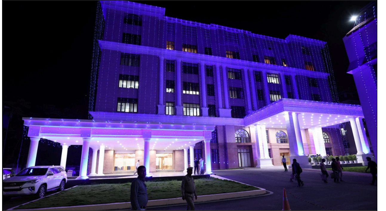
বিশ্ব শিশু দিৱস পালন কৰিবলৈ এনেদৰেই সজাই তোলা হৈছে অসম সচিবালয়, মুখ্যমন্ত্ৰীয়ে স্বেয়াৰ কৰিলে ফটো