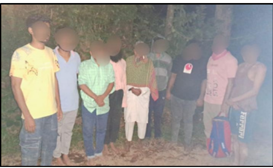
কৰিমগঞ্জৰ ভাৰত-বাংলাদেশ সীমান্তত ৯ বাংলাদেশীক আটক