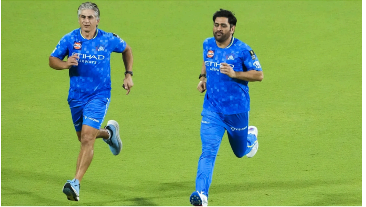
আইপিএলৰ পূৰ্বে এনেদৰে অনুশীলনত ব্যস্ত টমী ছিমচেকৰ সৈতে চেম্ৰাই ছুপাৰ কিংছৰ মহেন্দ্ৰ সিং ধোনি