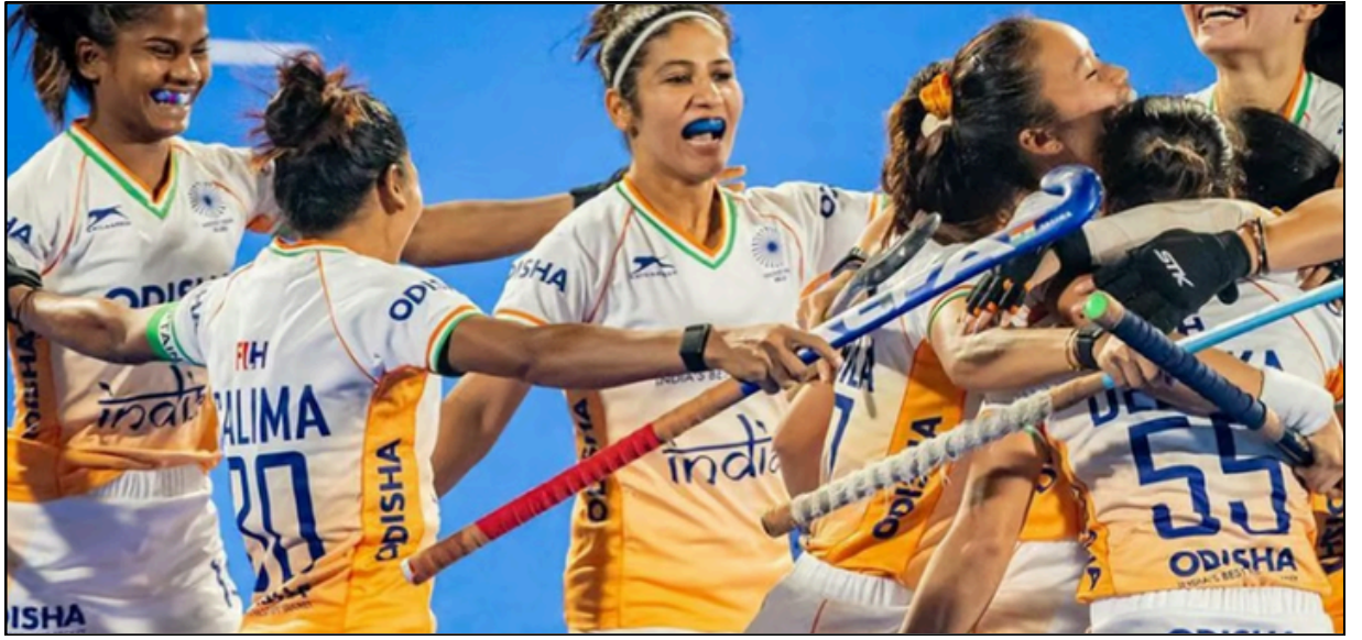
এছিয়ান চেম্পিয়নছ ট্ৰফী জয়ৰ পিছত ভাৰতীয় খেলুৱৈসকলৰ উল্লাস, বুধবাৰে