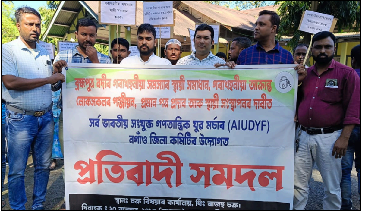
খহনীয়াৰ বিৰুদ্ধে নগাঁৱত এআইইউডিআইএফৰ প্ৰতিবাদ