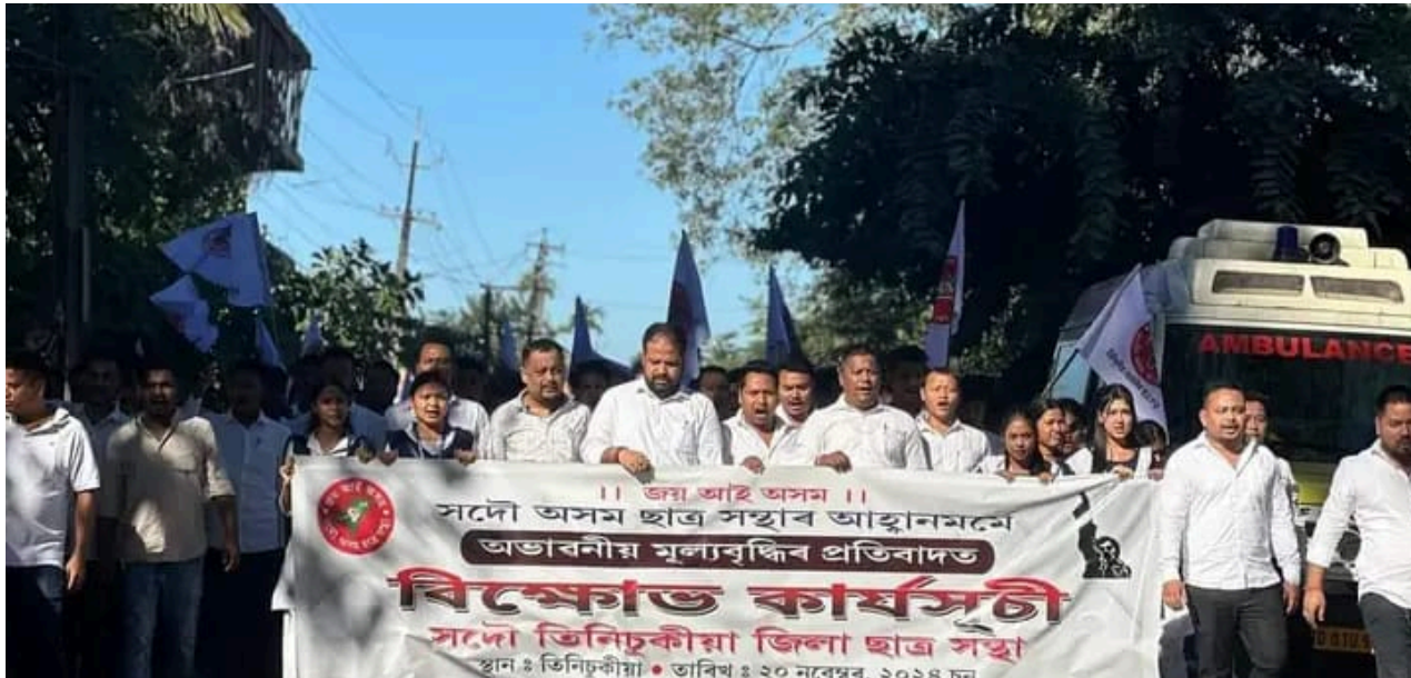
মূল্যবৃদ্ধিৰ বিৰুদ্ধে তিনিচুকীয়াত আছুৰ প্ৰতিবাদ