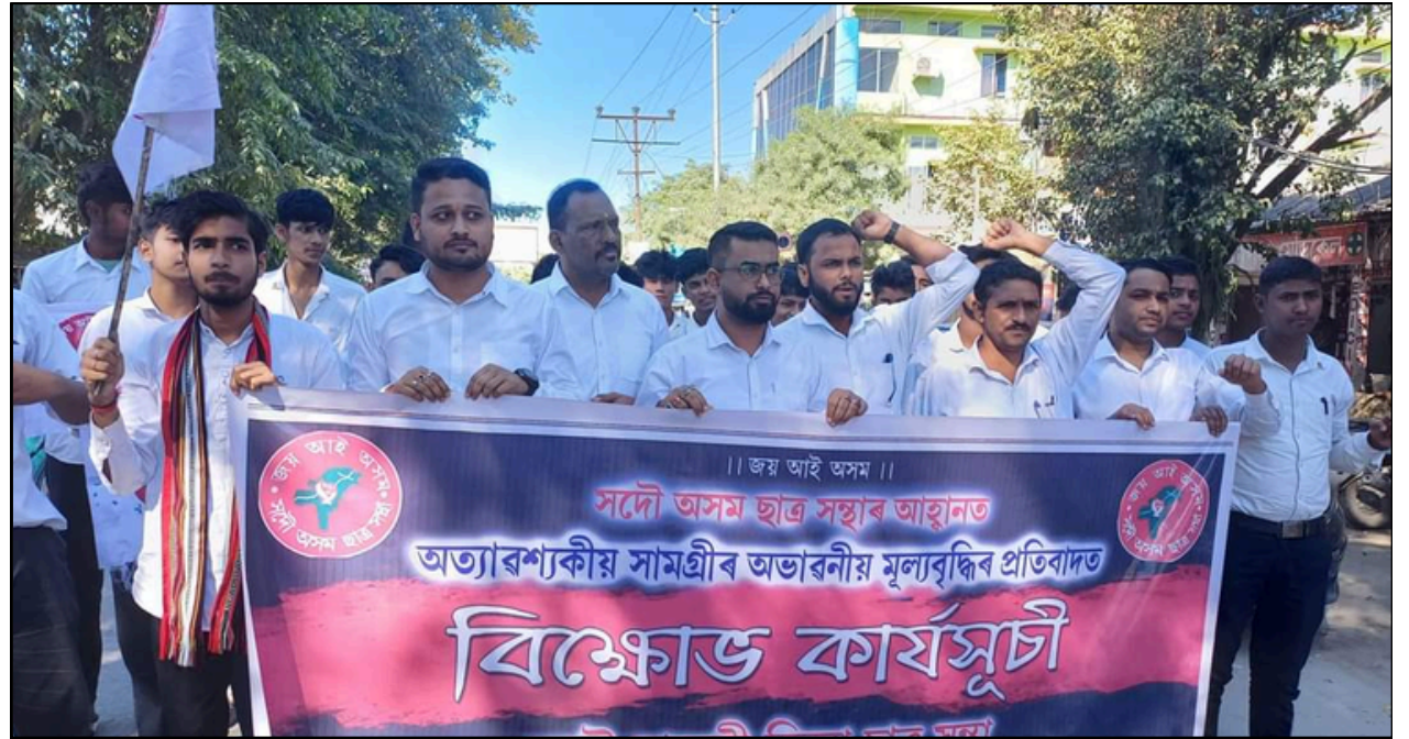
মাজুলীত আছৰ মূল্যবৃদ্ধিৰ বিৰুদ্ধে প্ৰতিবাদ