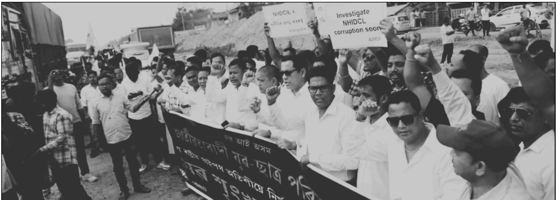
ৰাষ্ট্ৰীয় ঘাইপথৰ ফ'ৰলেনৰ কাম শীঘ্ৰে সম্পূৰ্ণ কৰাৰ দাবীত এজেৰাইচিপিৰ মানৱ শৃংখল কাৰ্যসূচী, যোৰহাটত সোমবাৰে