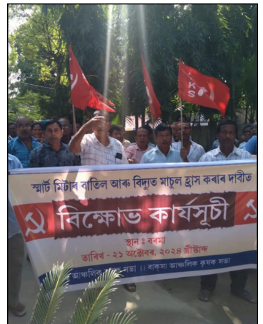
বৰমাত স্মাৰ্ট মিটাৰ বাতিল বিদ্যুত মাচুল হ্রাস কৰাৰ দাবীত বিক্ষোভ কাৰ্যসূচী