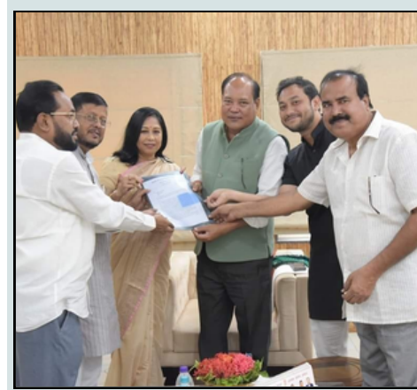
চামগুৰি কাণ্ডৰ পাছতে বিধায়কৰ সুৰক্ষা দাবী কৰি বিধানসভাৰ অধ্যক্ষক পত্ৰ কংগ্ৰেছৰ কেইবাজনো বিধায়কৰ