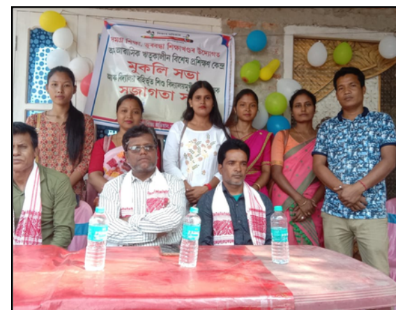
ভূৰক্ষা শিক্ষা খণ্ডৰ উদ্যোগত বিদ্যালয় বৰ্হিভূত শিশুৰ বিদ্যালয়মুখী কৰণ বিষয়ক সজাগতা সভা

মৰিগাঁও সদৰ থানাৰ এটি আৰক্ষীৰ দল ঘটনাস্থলীত উপস্থিত হৈ ৰাইজে আৱদ্ধ কৰি ৰখা আৰক্ষীৰ লোকজনক উদ্ধাৰৰ চেষ্টা কৰে। কিন্তু একাংশ লোকে আৰক্ষীক এই কাৰ্যত বাধা দি আৰক্ষীকো আক্ৰমণ কৰিবলৈ উদ্যত হোৱাত বাতৰি লিখা পৰ্যন্ত অঞ্চলটোত এক উত্তপ্ত পৰিস্থিতি বৰ্তি আছে। আৰক্ষী লোকজনে দীৰ্ঘদিন ধৰি এনে কৰি অহাৰ অভিযোগ উঠিছে।