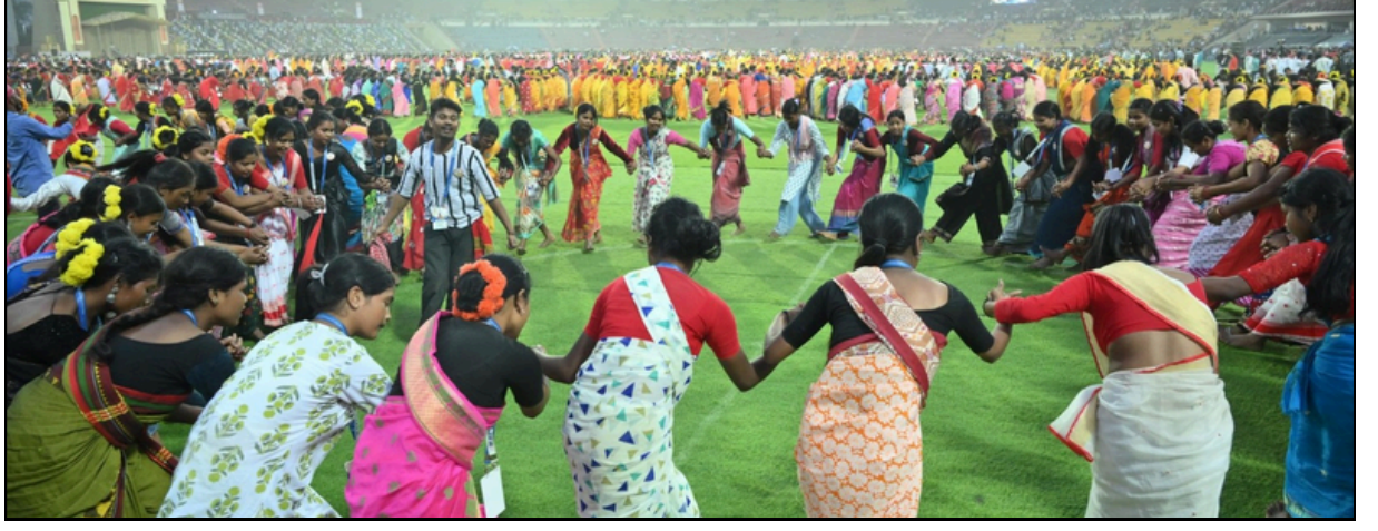
অভিলেখনে সাজু... অব্যাহত বুমুৰ নৃত্যৰ অনুশীলন, সৰুসজাইত শনিবাৰে