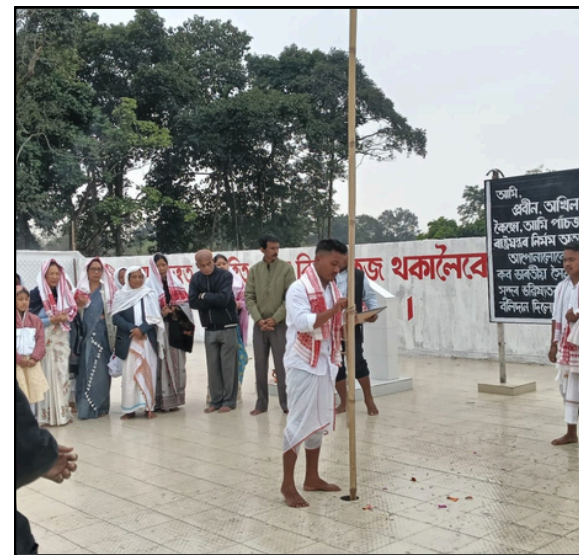
মৃত্যুবাৰ্ষিকীত ডাঙৰীৰ পঞ্চ শ্বহীদৰ সমাধিস্থলীত বাৰ্ষিক শ্ৰাদ্ধ সম্পন্ন, শনিবাৰে