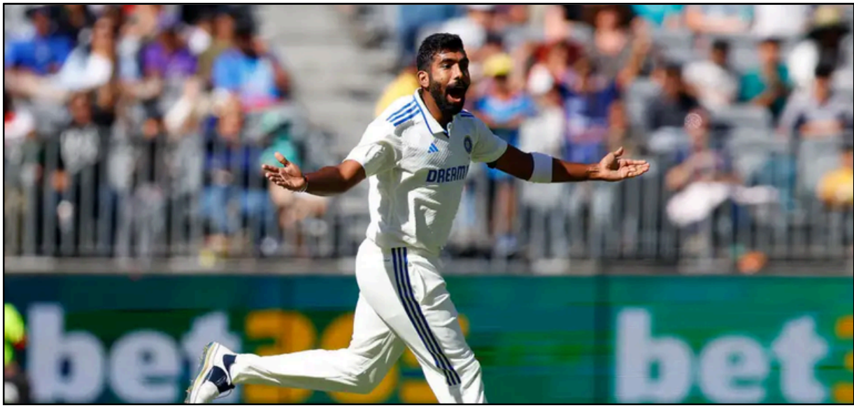
উইকেট দখলৰ পিছত যশপ্ৰীত বুমৰাহৰ উল্লাস প্ৰদৰ্শন, পাৰ্থত শুকুৰবাৰে