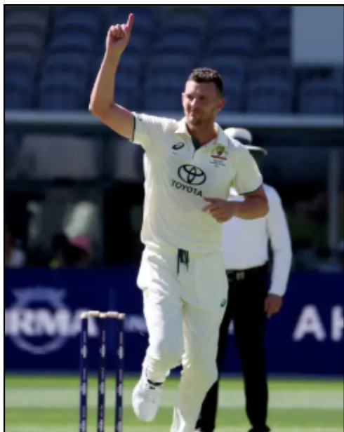
উইকেট দখলৰ পিছত অষ্ট্ৰেলিয়াৰ হেজেলউড

ই-সংবাদ, ২২ নৱেম্বৰঃ আজি এক পত্ৰ যোগে যোৰহাট নগৰৰ বৰুৱা চাৰিআলি-ভোগদৈ দলং সংযোগী উৰণীয়া সেতু নিৰ্মাণৰ সিদ্ধান্তক পুনৰ বিবেচনা কৰিবলৈ হিমন্ত বিশ্ব শৰ্মাক আহ্বান জনাইছে যোৰহাটৰ সাংসদ গৌৰৱ গগৈয়ে। সেতু নিৰ্মাণ হ'লে মানুহৰ জীৱন-জীৱিকা ধ্বংস হোৱাৰ লগতে ওলোটাই যান-জঁট সৃষ্টি হ'ব বুলি উল্লেখ কৰি মুখ্যমন্ত্ৰীক পত্ৰযোগে উল্লেখ কৰিছে গগৈয়ে। গৌৰৱ গগৈয়ে পত্ৰ যোগে যোৰহাট নগৰৰ বৰুৱা চাৰিআলি আৰু ভোগদৈ দলং সংযোগী এটি ৰোডত উচ্চ উৰণীয়া সেতু নিৰ্মাণৰ প্ৰস্তাৱক পুনৰ চিন্তা কৰাৰ প্ৰয়োজন বুলি কয়। উৰণীয়া সেতু নিৰ্মাণ কৰিলে দোকানীসকলৰ স্থানচ্যুত হ'ব বুলি দাবী কৰি গৌৰৱ গগৈয়ে কয় যে যাৰ ফলত তেওঁলোকৰ ব্যৱসায়িক চৌহদ সংকুচিত হৈ পৰিব। ফলস্বৰূপে তেওঁলোকৰ আয়ৰ প্ৰধান উৎস হেৰুৱাব। তদুপৰি, প্ৰস্তাৱিত উৰণীয়া সেতুৰ তলত কেইবাটাও বেংক, চৰকাৰী আৰু ব্যক্তিগত প্ৰতিষ্ঠানৰ কাৰ্যালয় আৰু উপাসনাস্থলী এই পথত থকাৰ বাবে জনসাধাৰণৰ যথেষ্ট অসুবিধাৰ সন্মুখীন হ'ব লাগিব। নিৰ্মাণৰ পিছত স্থানীয় জনতাক এই পথটো ব্যৱহাৰ কৰিবলৈ বাধ্য কৰাৰে তীব্ৰ যান-জঁট আৰু আতঙ্কলীয়া পৰিস্থিতিৰ সৃষ্টি হোৱাৰ সম্ভাৱনা আছে। যাৰ ফলত দৈনিক যাতায়ত কৰা লোকসকলৰ বাবে জীৱন যাত্ৰাত ব্যাঘাত জন্মাব আৰু বিভ্ৰান্তিৰ সৃষ্টি হ'ব। গগৈয়ে উদ্বেগ প্ৰকাশ কৰি মুখ্যমন্ত্ৰী হিমন্ত বিশ্ব শৰ্মাক প্ৰকল্পটো স্থগিত ৰাখি সকলোৰে সৈতে আলোচনা কৰিবলৈ আৰু ডিজাইনৰ পুনৰ মূল্যায়নৰ আহ্বান জনায়।