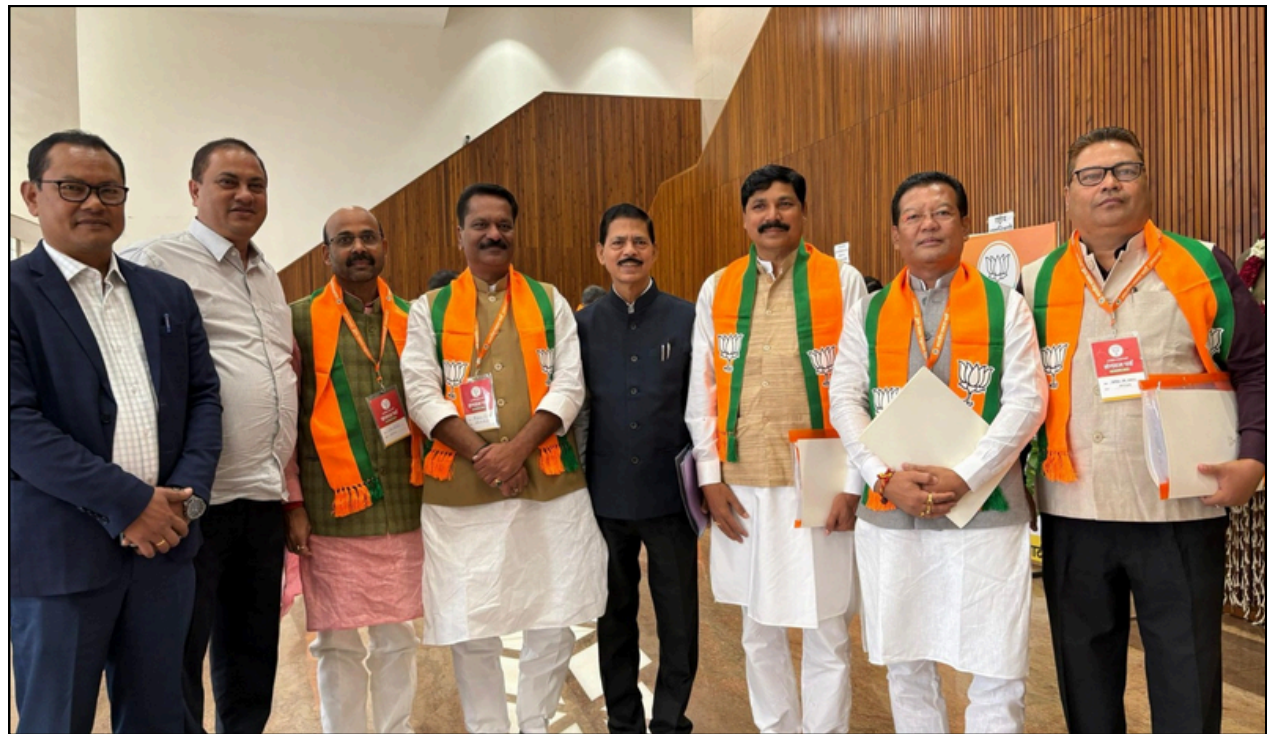
দিল্লীত অনুষ্ঠিত বিজেপিৰ সাংগঠনিক বৈঠকত অসমৰ প্ৰতিনিধি দলটো

উক্ত পথটি নিৰ্মাণৰ বাবে গগৈ উপাধিৰ এজন ঠিকাদাৰক কামৰ আবণ্টন দিয়ে যদিও তেওঁ মূল পথটিৰ কাম সামান্য মাটি পেলাই বন্ধ কৰি ৰাখে। ইয়াৰ ফলত শ্ৰমিক ৰাইজে বিভিন্ন ধৰণৰ সমস্যাৰ সন্মুখীন হোৱাৰ বিষয়ে বিভাগীয় হাজৰিকা উপাধিৰ কনিষ্ঠ অভিযন্তাজনক বহুবাৰ অভিযোগ দিয়াৰ কথা পত্ৰখনত উল্লেখ কৰাৰ লগতে তেওঁ এই ক্ষেত্ৰত কোনো গুৰুত্ব নিদিয়াৰ অভিযোগ উত্থাপন কৰিছে। পত্ৰখনত আটছাই তিনিটা দিনৰ ভিতৰত উক্ত কাম আৰম্ভ নকৰিলে অনতিপলমে বৃহৎ গণতান্ত্ৰিক আন্দোলন গঢ়ি তুলিব বুলি পত্ৰখনত উল্লেখ কৰে।