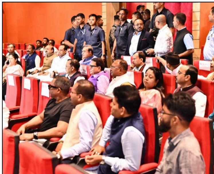
পাঞ্জাবীৰ আইদেউ চিনেমা হলত 'দ্য সবৰমতী বিপৰ্ট' চলে মুখ্যমন্ত্ৰীয়ে

ই-সংবাদ, কামপুৰ, ২২ নবেম্বৰঃ এগৰাকী ৬ বছৰীয়া কন্যা সন্তানৰ মাতৃয়ে এতিয়া ন্যায় বিচাৰি জনাইছে কাতৰ আহান। স্বামী আৰু শাশুৰ নানান অত্যাচাৰৰ বলি হোৱা ৬ বছৰীয়া কণমানি শিশুৰ মাতৃ এগৰাকীৰ কৰুণ কাহিনীয়ে কামপুৰ-কটীয়াতলী অঞ্চলত প্ৰতিক্ৰিয়াৰ সৃষ্টি কৰিছে। শেষাংশ ৮ পৃষ্ঠাত