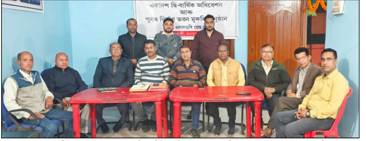
ওদালগুৰি প্ৰেছ ক্লাবৰ একাদশ দ্বি-বাৰ্ষিক অধিবেশনৰ সামৰণি