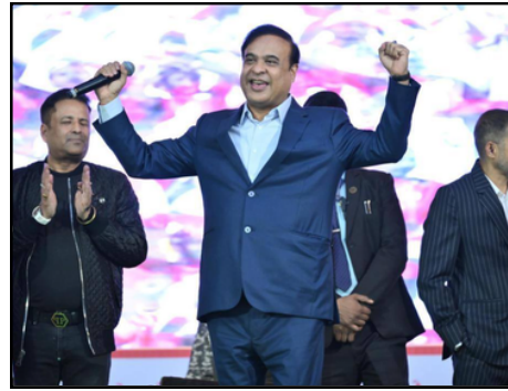
মুখ্যমন্ত্ৰীয়েও নাচিলে এপাক...

■ এডভাণ্টেজ আছামত ভাগ ল’বলৈ নিশাই যোৰহাটত বিদেশ মন্ত্ৰী ই-সংবাদ, ২৩ ফেব্ৰুৱাৰীঃ এডভাণ্টেজ আছাম ২.০ৰ লগতে বিশ্ব অভিলেখ গঢ়িবলৈ আয়োজন কৰা বুমুৰ নৃত্যৰ অন্তিম আখৰা চলি থকাৰ মাজতে আজি ৫ পৃষ্ঠাত চাওক