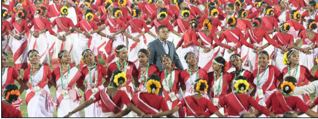
অভিলেখ গঢ়িবলৈ সাজু বুমুৰ শিল্পী, দেওবাৰে সৰসজাহিৰ এক নান্দনিক দৃশ্য

‘মন কী বাত’ত ঘোষণা প্ৰেৰণাদায়ক মহিলাক মোদীৰ বিশেষ উপহাৰ নতুন দিল্লী, ২৩ ফেব্ৰুৱাৰীঃ এইবাৰ ৰাষ্ট্ৰীয় নাৰী দিৱসত এক নতুন পদক্ষেপ গ্ৰহণ কৰিব প্ৰধানমন্ত্ৰী নৰেন্দ্ৰ ৪ পৃষ্ঠাত