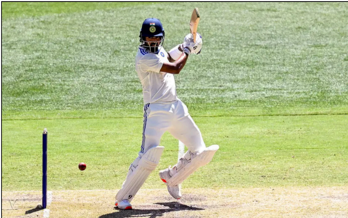
অষ্ট্ৰেলিয়াৰ বিৰুদ্ধে পাৰ্থ টেষ্টৰ দ্বিতীয় দিনা দ্বিতীয় ইনিংছত কেএল ৰাছলৰ দৃষ্টিভঙ্গন শ্বট, শনিবাৰে

২১৮ ৰানৰ অগ্ৰগতি, ১০৪ত অলআউট অষ্ট্ৰেলিয়া