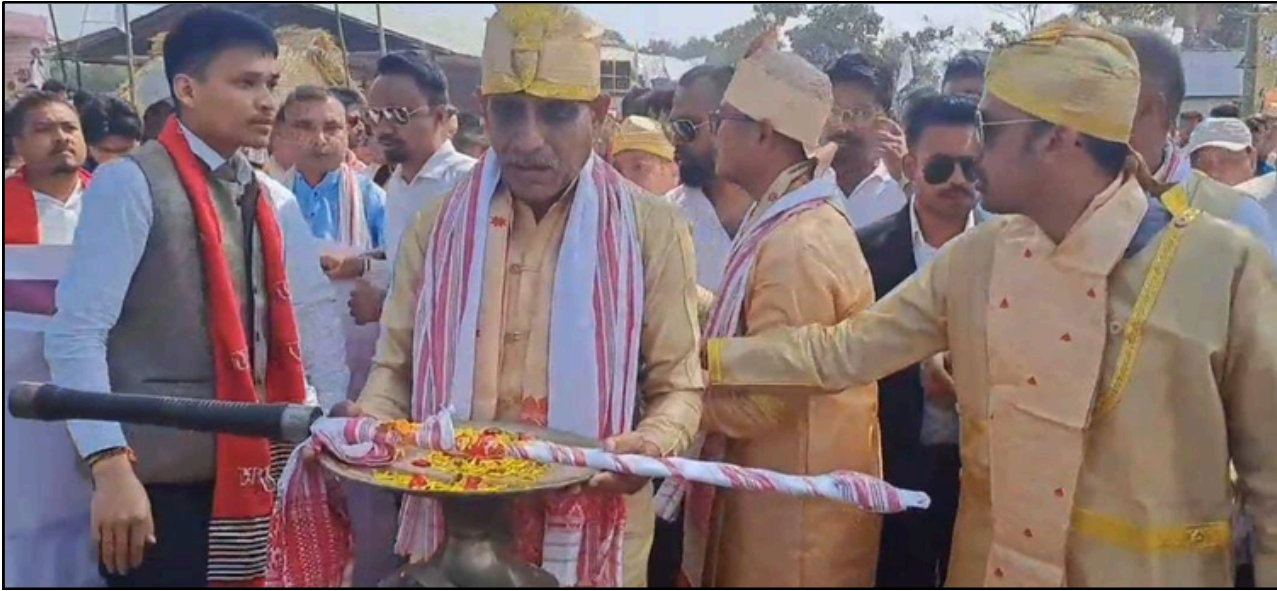
যোৰহাটৰ মেলেঙৰ বীৰ লাচিত বৰফুকন ক্ষেত্ৰত অসম খিলঞ্জীয়া দিৱস উদযাপন

অভিযানৰ সঞ্চালকে বিষয়টো অনুসন্ধান কৰাত যোৰহাটসহ কেবাখনো জিলাত ধন সংগ্ৰহৰ অভিযোগ প্ৰমাণ হয়। সেয়ে সংগৃহীত ধন বিদ্যালয়প্ৰধানসকলক ঘূৰাই দিবলৈ ২২ ফেব্ৰুৱাৰীত সমগ্ৰ শিক্ষা অভিযানৰ মিছন সঞ্চালকে কঠোৰ নিৰ্দেশনা প্ৰেৰণ কৰে। উল্লেখ্য, যোৰহাট জিলাৰ এই বিনামূলীয়া ইউনিফৰ্মৰ মান নিৰূপণৰ বাবে ২৮ খন শিক্ষানুষ্ঠানত পৰীক্ষাগাৰৰ ব্যৱস্থা কৰা হৈছিল। সেই পৰীক্ষাগাৰত মান নিৰূপণৰ বাবে ব্যয়ৰ বাবদ ৩০০ টকাকৈ সংগ্ৰহ কৰিবলৈ বিভাগীয়ভাৱেই নিৰ্দেশনা দিয়া হৈছিল। যোৰহাট শিক্ষাখণ্ডৰ ৩৭ টা ক্লাষ্টাৰৰ এলেকাভুক্ত ২৫৯ খন শিক্ষানুষ্ঠানৰ ভিতৰৰ যিসমূহ শিক্ষানুষ্ঠানৰ পৰা ধন সংগ্ৰহ কৰা হৈছিল সেই ধন সমগ্ৰ শিক্ষা অভিযানৰ সঞ্চালকৰপৰা পোৱা কঠোৰ নিৰ্দেশনাৰ ভিত্তিত আজি যোৰহাট শিক্ষা খণ্ডটোৰ বিষয়াগৰাকীয়ে চি আৰ চি চিসকলক মাতি আনি সংগৃহীত ধন তৎকালে ঘূৰাই দিবলৈ নিৰ্দেশনা দিছে বুলি জানিবলৈ দিছে।