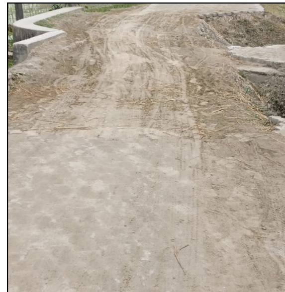
বিধ্বস্ত ধুপালপাৰা-আনন্দপুৰ পথটো

সম্পূৰ্ণৰূপে ছিন্ন-ভিন্ন কৰি পেলোৱা পৰিলক্ষিত হৈছে। অঞ্চলটোৰ ৰাইজে বাৰিষাকালি ব্লক টেপিং পথছোৱা সম্পূৰ্ণৰূপে পানীত বুৰ যোৱাৰ কথাও জানিবলৈ দিছে। বিধিসম্মত আৰু ওখকৈ নিৰ্মাণ নোহোৱাত সংশ্লিষ্ট পথছোৱাৰ ঠায়ে ঠায়ে ব্লকসমূহ এৰাই যোৱাও দেখা গৈছে। আধৰুৱাকৈ নিৰ্মাণ কৰাৰ ফলত সংশ্লিষ্ট ব্ৰীজ কেনেলখনৰ ওপৰৰ মাটি তললৈ বহি যোৱাৰ লগতে দুয়োখন গাৰ্ড ৱালৰ কাষতে ভয়ংকৰ খহনীয়াৰ সৃষ্টি হৈছে। আনহাতে, প্ৰচণ্ড বানে খহাই নিয়া ব্ৰীজ কেনেলৰ ভগ্ন পকী অংশসমূহ পথৰ কাষৰ খাৱৈত পৰি থকা দৃশ্যমান হৈছে।