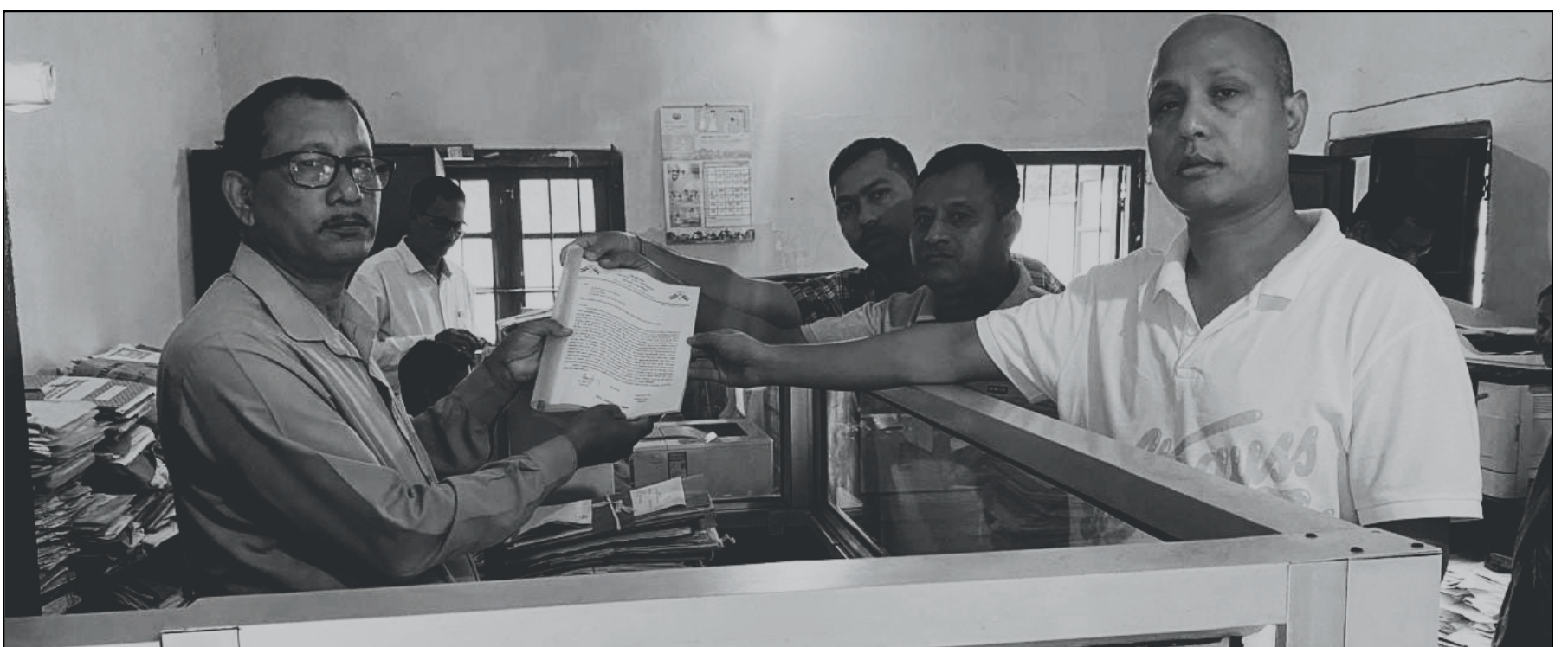
চামগুৰি ৰাজহ চক্ৰৰ কাৰ্যালয় বন্ধ কৰিব খোজা কাৰ্যৰ বিৰুদ্ধে সৰৱ অগপে ৰাজ্য চৰকাৰলৈ প্ৰেৰণ কৰিছে স্মাৰক পত্ৰ