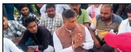
প্ৰতিবাদী সাংবাদিকক হাতযোৰ মন্ত্ৰী পীয়ুষৰ